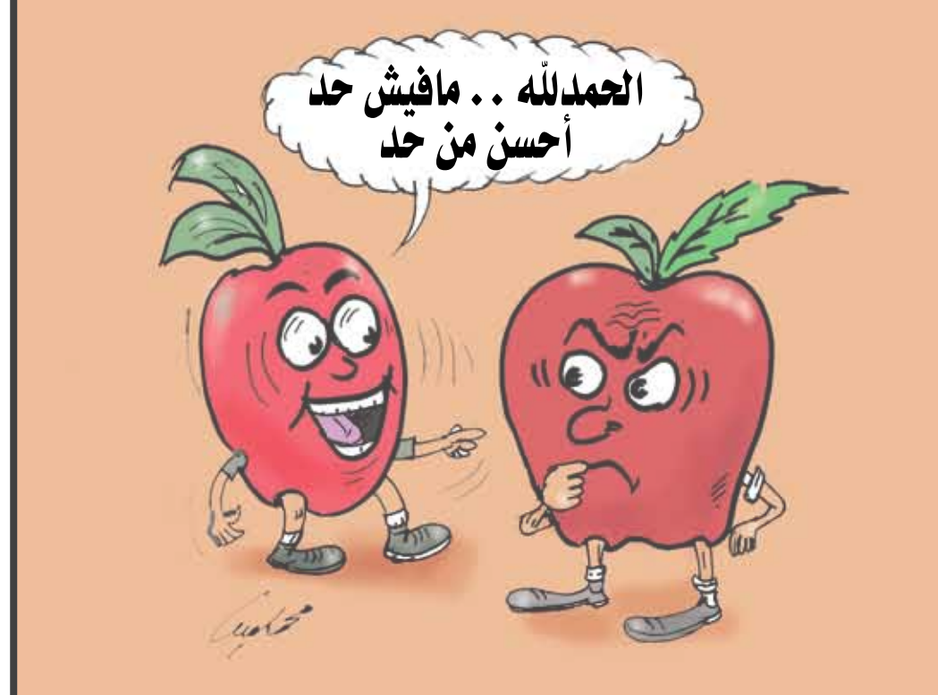
الحمد لله .. ما فيش حد أحسن من حد