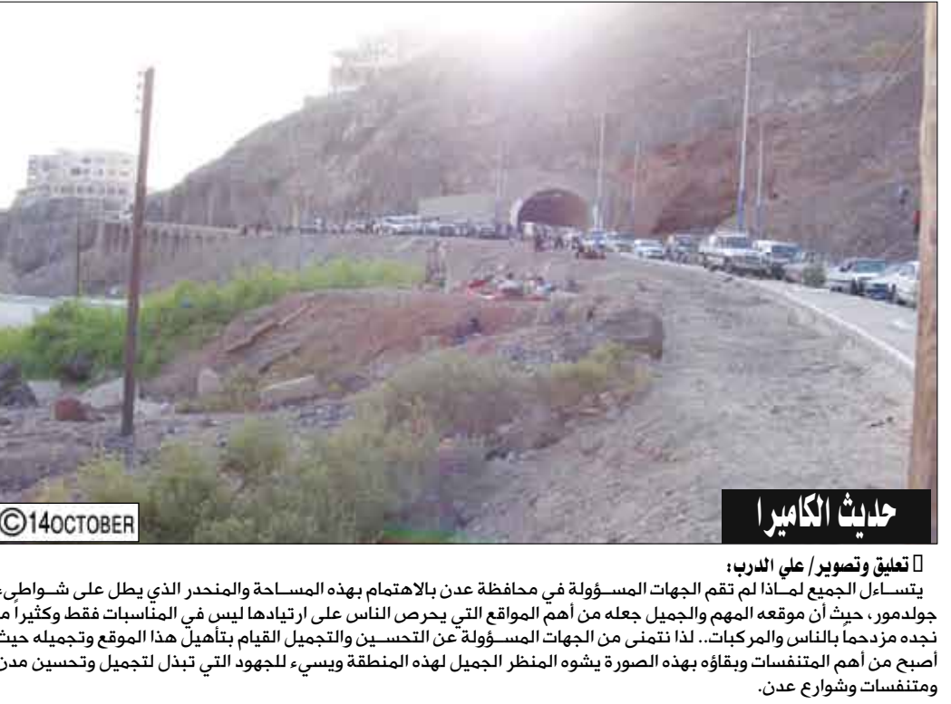
حياث الكاميرا تساءل الجميع لماذا لم تقم الجهات المسؤولة في محافظة عدن بالاهتمام بهذه المساحة والمنحدر الذي يطل على شواطئ جولد مور، حيث أن موقعه الجميل جعله من أهم المواقع التي يحرص الناس على ارتيادها ليس في المناسبات فقط وكثيرا ما نجد مزدحما بالناس والمركات.. لذا نتمنى من الجهات المسؤولة عن التحسين والتجميل القيام بتأهيل هذا الموقع وتجميله حيث أصبح من أهم المتنفسات ويقاؤه بهذه الصورة يشوه المنظر الجميل لهذه المنطقة ويسبب للجهود التي تبذل لتجميل وتحسين مدن ومتنفسات وشوارع عدن.