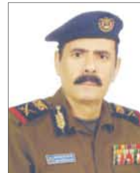
اللواء الركن صالح الزوعري

عدن/ عيدروس نورجي، أكد اللواء ركن / صالح حسين الزوعري نائب وزير الداخلية بأن عظمة 30 نوفمبر التاريخية في إزالة شعبنا اليمني العظيم للكيانات الهزلية التي كانت قائمة عام 67م بالمحافظات الجنوبية والشرقية في اليمن الغالي... وفي التوقيع على اتفاق عدن التاريخي عام 89م لاستعادة وحدة وحدتنا المباركة أرضاً وشعباً والذي مهد الطريق لإعلان عن قيام الجمهورية اليمنية في 22 مايو وبرفع علمها من قبل فخامة الرئيس علي عبدالله صالح حفظه الله ليعلن للعالم عن انتصار إرادة شعبنا اليمني في القضاء وإنهاء عهد التشطير في الطرق السلمية. وأوضح اللواء الركن/ صالح الزوعري بأنه يستطيع القول بأن الثلاثين من نوفمبر 67م قد وضع اللبنة الأولى لاستعادة شعبنا اليمن وحدته المباركة ففي 30 نوفمبر 67م رحل آخر جندي بريطاني من عدن التي كانت مستعمرة طيلة 129 عاماً وجاء رحيله تويجاً لانتصار ثورة 14 أكتوبر والذي كان هدفها تحرير جنوب اليمن المحتل والتي أسهم أبناء الوطن من مختلف المحافظات بحماسة المستعمر إيماناً منهم بوحدانية ثورة 26 سبتمبر و 14 أكتوبر وفي الثلاثين من نوفمبر 67م تجلّى لشعبنا وللعالم بوضع الهوية اليمنية لما كانت تسمى