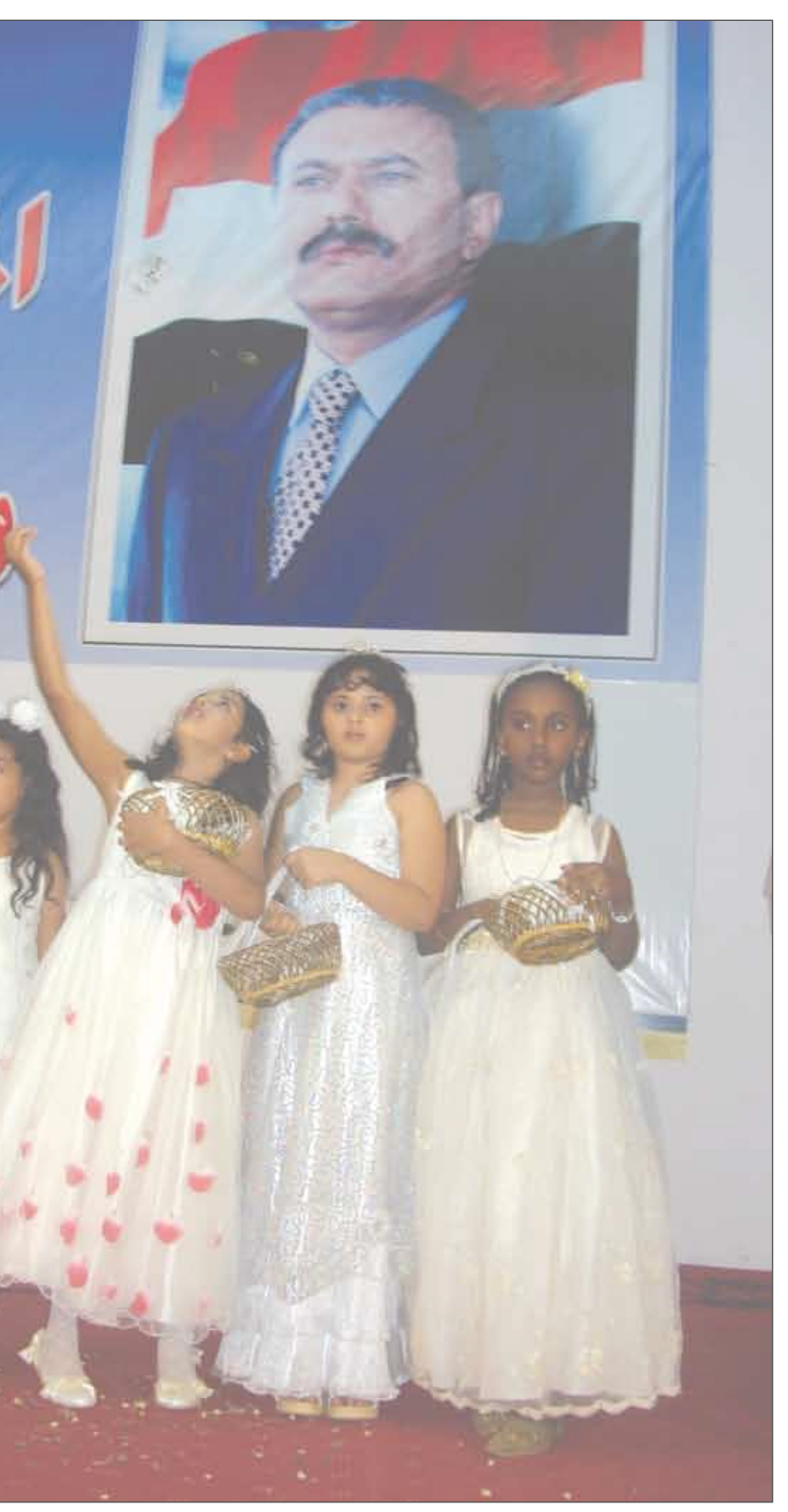
الأطفال ينثرون الورد على صورة فخامة الرئيس خلال حفل فني أقيم في إطار الملتقى الوطني للمبدعين الشباب أمس الأول .

تنتاب البعض للأسف في الحزب الاشتراكي عقدة مزمنة حيال موضوع تطبيق قانون التقاعد على أحد هؤلاء فيجوز أن يحال أحدهم إلى التقاعد طبقا للقانون أو يتم نقله إلى وظيفة أخرى طبقا لمقتضيات المصلحة الوطنية كسائر المواطنين وسواء كان هذا الشخص في الجيش أو الأمن أو في السلك الدبلوماسي أو القطاع المدني وهو أمر طبيعي يتقبله الجميع دون حساسية أو تفسيرات خاطئة من أي نوع باعتبار أن العمل الوظيفي في كل بلدان العالم محكوم دوما بأنظمة ومقتررة زمنية محددة بعدها يحال الموظف إلى التقاعد عند بلوغه أحد الأجلين أو يتم نقله إلى وظيفة أخرى وبحسب ما تفرزه المصلحة العامة الإ هؤلاء ( البعض ) في الاشتراكي فإنهم يرون أنفسهم فوق النظام والقانون والمناصب وفي الوظيفة العامة التي هم فيها وعدم الترحح عنها قيد أنملة حتى يحل بهم الموت. ما لم فإنهم سرعان ما ينقلبون على أعقابهم وينكرون كل شيء ويعيدون تطبيق قانون التقاعد استهدافا شخصيا لهم وانهم ينبغي أن يكونوا مغولين ويعمل هؤلاء ونتيجة لذلك إما إلى طلب اللجوء في الخارج أو التحول إلى ( انفصالي ) حتى العظم يتبنى دعوات طلب المناطقية والشطرية أو يصبح متظلما يشكو حاله لكل من هب ودب ويرى في تطبيق القانون عليه إعتسافا لحقوقه وتمييزاً يستهدفه دون بقية خلق الله وهذا هو البلاء بذاته والجهل بعينه.