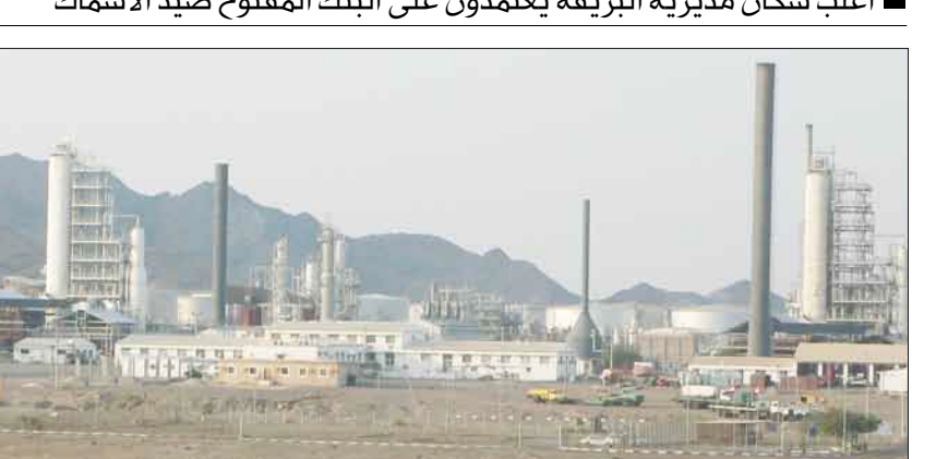
مصفاة عدن جبل الوريد وشريان الحياة لمحافظة عدن

من (عشرة ملايين إلى 15 مليون دولار أمريكي)، كما يوجد مشروع القطار الجوي في غير البريقة وهو يعمل بشكل ممتاز.