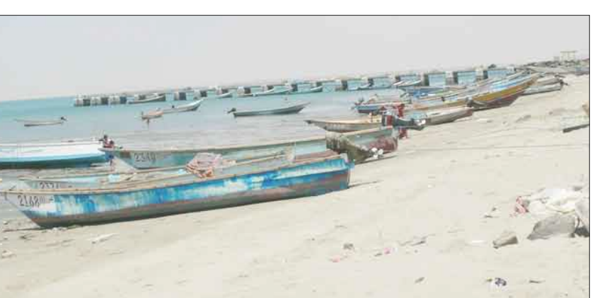
أغلب سكان مديرية البريقة يعتمدون على البنك المفتوح صيد الأسماك

ستستفيد مديرية البريقة من استعدادات (خليجي 20) أنه سيتم رصد مبلغ كافير للبنية التحتية في الصرف الصحي لمديرية البريقة وعلى وجه الخصوص منطقة صلاح الدين، والأل نحن وما زالت مركزية الأشغال ممثلة بمكتب الأشغال