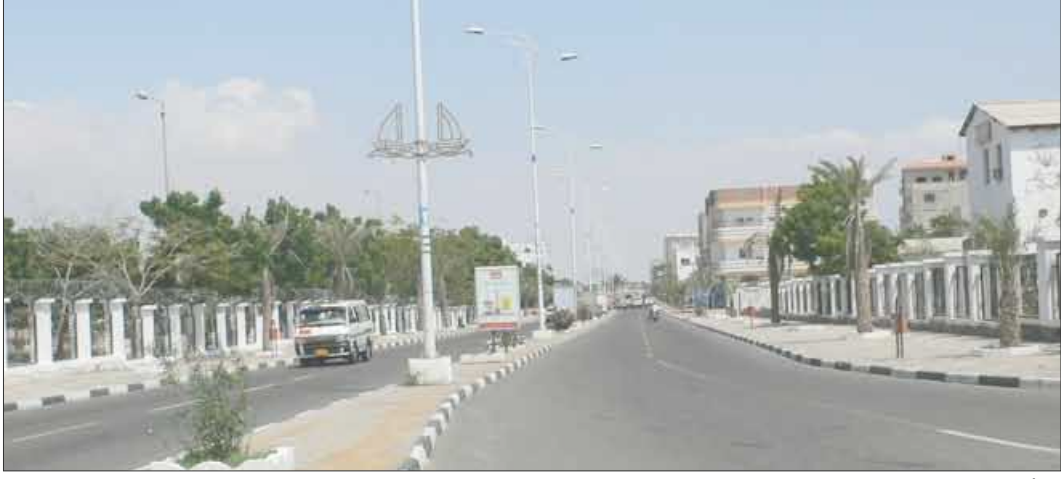
أحد شوارع مديرية البريقة تم استحداثه ضمن المشاريع المنفذة

14 أكتوبر نزلت إلى هذه المديرية لتلمس أوضاعها من خلال مجموعة من اللقاءات .. وهاكم الحصيلة