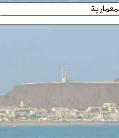
مديرية البريقة خطوط حديثة في الهندسة المعمارية

إن جمعية أنا وليس إعاقتي للتنمية تحضن حاليا الأطفال من ذوي الفئات الخاصة لكل أنواع الإعاقات: حركية، ذهنية، صم، بكم، كفيفين - داوون (منقول) وأتيزم التوحد. للجمعية أهداف منها قصيرة المدى - وطويلة المدى، وأهداف عامة هي: تعليم الطفل من ذوي الفئات الخاصة القراءة والكتابة. وتأهيلهم وتدريبهم لكافة أنواع المهارات اليومية كالغناء بالذات، التواصل مع العالم المحيط بهم في الداخل والخارج. إخراج الأطفال من ذوي الفئات الخاصة من