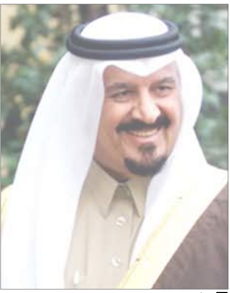
الأمير سلطان بن عبدالعزيز

وأوضح التركي أنه من المهم عرض النماذج الناجمة للاقتصاد الإسلامي عبر هذا الملتقى الذي يقام للمرة الأولى حيث يدرك الجميع أن الجانب التطبيقي كما يتعلق بالاقتصاد الإسلامي جزئياً كان في البنوك الإسلامية وشركات الاستثمار أو توظيف الأموال رغم نجاح الكثير من التجارب منه إلا أنه لا يعطي المفهوم الحقيقي المطلوب للاقتصاد الإسلامي الذي يقصد به اقتصاديات الدول الإسلامية التي نجحت في تحقيق الإصلاح ونجحت في تقديم نموذج قوي وواضح للعالم مثل الاقتصاد السعودي الذي نفضح جميعاً بأنه يعيش أزهى عصوره ويستمد قوته من السياسات الناجحة التي يجري تطبيقها بشفاقة ووضوح والأمر نفسه ينطبق على التجربة الماليزية التي أبهرت العالم في وقت سابق بعد أن تحولت من الفقر المضحج إلى الاعتماد على الذات حتى باتت أحد النور الاسيوية التي ينظر لها العالم باحترام وتقدير.