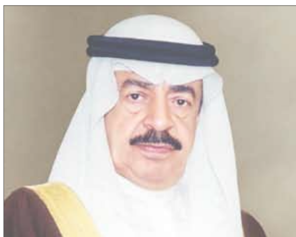
الشيخ خليفة بن سلمان