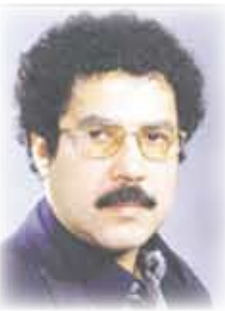
الشاعر العماني / سيف الرحبي