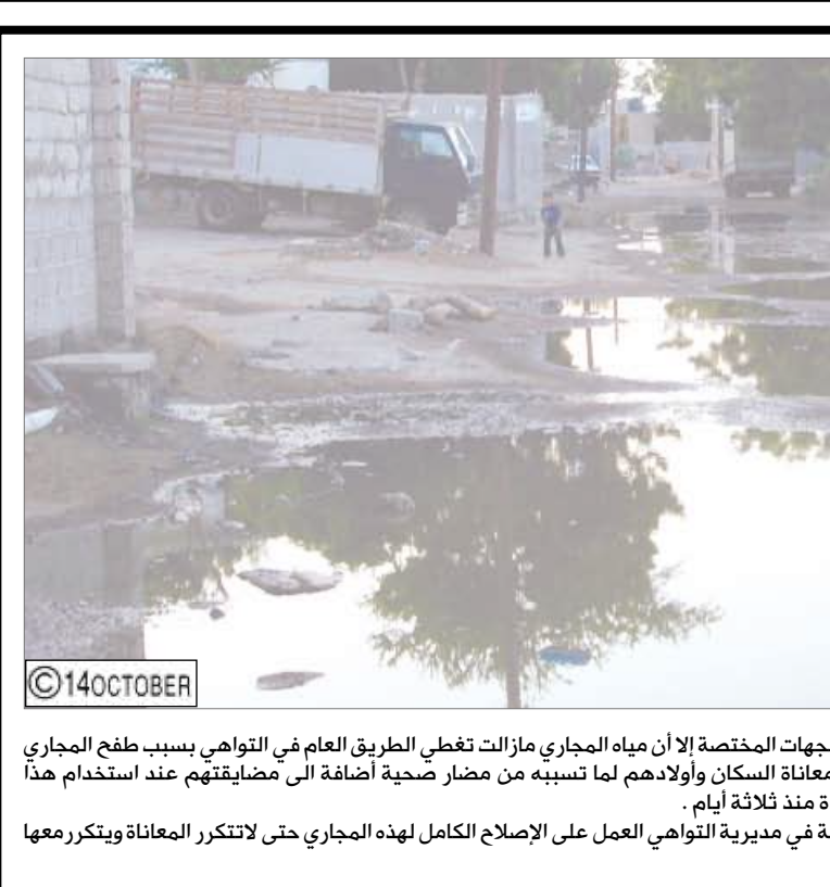
حدث الكابيرا رغم عمليات الشطف التي قامت بها الجهات المختصة إلا أن مياه المجاري مازالت تغطي الطريق العام في التواهي بسبب طفق المجاري المتكرر في هذا الشارع ومعه تتكرر معاناة السكان وأولادهم لما تسببه من مزار صحية إضافة الى مضايقتهم عند استخدام هذا الطريق المغطى بمياه المجاري الراكدة منذ ثلاثة أيام . لذا يتبنى الجمع من الجهات المختصة في مديرية التواهي العمل على الإصلاح الكامل لهذه المجاري حتى لا تتكرر المعاناة ويتكرر معها هذا المنظر .