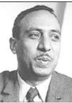
الشاعر صلاح عبد الصبور