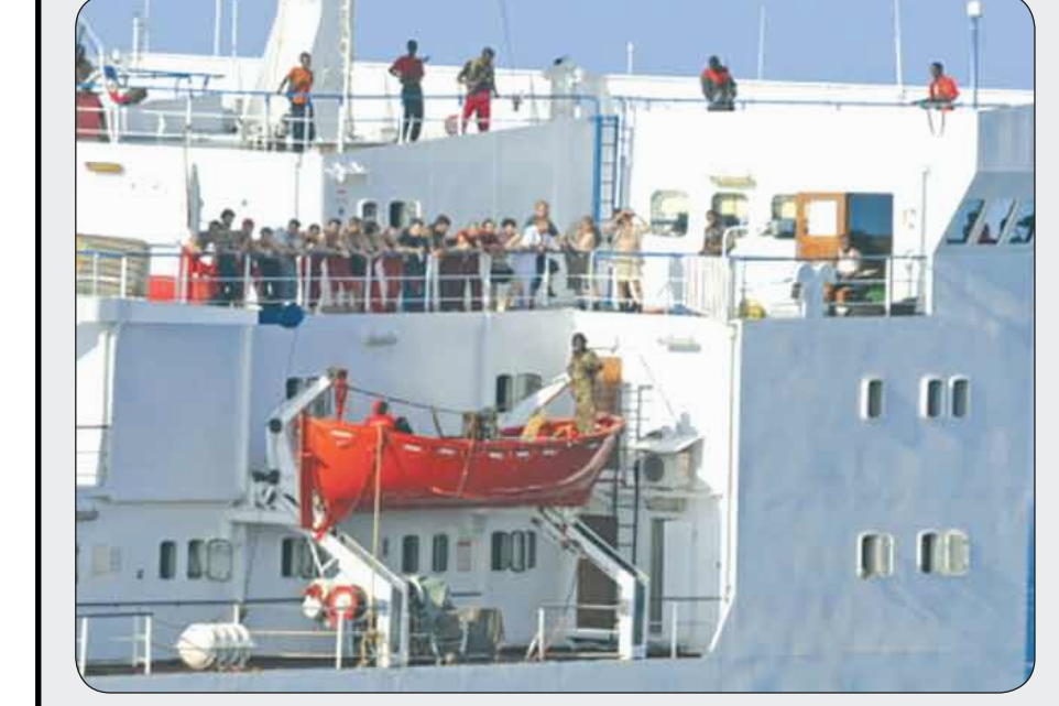
صورة التقطتها القوات الأمريكية أثناء هجوم أكتوبر الماضي