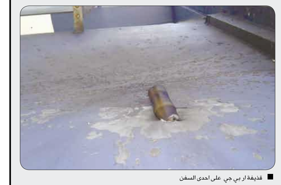
قديفة ار بي جي على إحدى السفن

عملاقة محملة بشحنة قيمتها مئة مليون دولار من المحيط الهندي في مطلع الأسبوع مستهزئين بمسعى لحلف شمال الأطلسي والاتحاد الأوروبي للتعامل مع مشكلات القرصنة في واحد من أكثر طرق الملاحة البحرية نشاطا. وتركت الحرب المستمرة في الصومال منذ ما يقرب من 20 عاما البلاد غارقة بالأسلحة وبدون سلطة مركزية قوية قادرة على فرض القانون. ويستحب قراصنة مدججون بالسلاح السفن المستهدفة عادة من أي من جانبيها بزوارق سريعة ويطلقون النار أو قذائف صاروخية إذا حاول قبطن السفينة الفرار ويستخدمون سفنا أكبر لزيادة قدرتهم على الوصول لمياه أبع. وفي معظم الحالات يتفاوض ملاك السفن على دفع فدية لإفراج عن السفن وأفراد الطاقم دون أن يسهم أي. ولكن تزايد المخاطر يعني ارتفاع أقساط التأمين يجعل بعض السفن تتسلك بعض الناقلات في الوقت الحالي الطريق الطويل حول جنوب أفريقيا بدلا من قناة السويس ما زاد من أسعار السلع في وقت يسود فيه الغموض على المستوى العالمي. والسفن والبيارات هي ثالث سفينة شحن ترفع علم هونغ كونغ يتم خطفها في المنطقة في فصل الخريف الحالي. وقال المسؤول في مركز الإنقاذ البحري «لدينا الآن سفينتان تفرغان علم هونغ كونغ يحتجزهما قراصنة صوماليون وتم الإفراج عن سفينة واحدة». وأفراد الطاقم على السفينة ديلايت من إيران وباكستان والهند والفلبين وجوبانا. وكانت السفينة تحمل 36 ألف طن من الفحم إلى ميناء بندر عباس في إيران. وكانت السفينتان الأخريان اللتان يحتجزهما القراصنة مستجرتين لمجموعة شتولت نيلسن للناقلات الكيماويات. وخطف السفينة شتولت ستريث هذا الشهر بعد أيام قليلة من الإفراج عن السفينة شتولت فالو التي خطفها في سبتمبر.