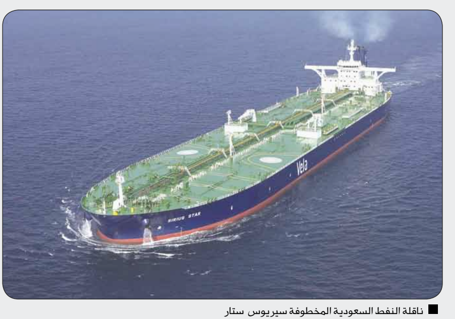
ناقلة النفط السعودية المخطوفة سيربوس ستار

خليج عدن / فطار أحمد : أصبحت القرصنة البحرية من المخاطر التي تهدد النقل البحري في العالم وسلامة العاملين فيه وتكبد هذه الصناعة الملايين سنويا، ما دعا الدول والمنظمات العالمية إلى إعلان الحرب على القراصنة مؤخرا بعد ازدياد هجمات القرصنة في العالم وخصوصا في خليج عدن الذي يعتبر ممرا دوليا رئيسيا بين الشرق والغرب. ويقوم قراصنة الصومال بشن هجمات تكاد تكون شبه يومية على السفن المارة في خليج عدن والتي إزدادت بعد بدء دوريات الحماية البحرية الدولية في الخليج في أكتوبر الماضي ما يعتبر تحديا واضرا وأضحا من قراصنة الصومال على استمرار الهجمات. يستخدم قراصنة قنليات حديثة وأفرادا مدربين للهجوم على السفن والصعود عليها أثناء إبحارها مستخدمين قوارب سريعة وأسلحة خفيفة وثقيلة في بعض الأحيان ليلا أو في وضع النهار. وبمجرد الصعود على السفينة التي عادة ما يكون طاقمها مجردا من السلاح يقوم القراصنة بالاستيلاء عليها واحتجاز طاقمها والتوجه بها إلى جهات غير معلومة بعد فصل الأجهزة التي تعرف السفينة مما يصعب عملية تعقبها... وفي أغلب الحالات يكون مصير الطواقم مجهولا.. وهناك جماعات منظمة تقوم بإعادة تشغيل هذه السفن بعد تغيير معالمها واسمها مستخدمين شهادات تسجيل مؤقتة أو مزيفة لتشغيلها لبعض الوقت أو التخلص منها عندما تكون البضائع التي عليها غنيمة كافية. ودوريات الحماية الدولية في خليج عدن نجحت مؤخرا في إحباط بعض الهجمات واستعادة سفن مع طواقمها سالمين مما يشكل مزيمة لقراصنة الصومال ولكن لم يتم القضاء على القرصنة في خليج عدن بعد.. وحسب تقرير مركز مراقبة القرصنة في كوالا لمبور الأمامي فرانك فانتر شتاينماير، تقع في سبع صفحات وتتناول وأكبر هجوم هو الهجوم على الناقلة التابعة لشركة ارامكو