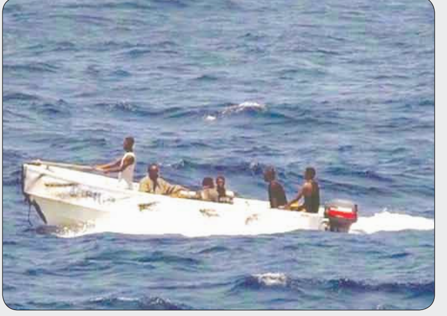
قراصنة صوماليون بالزوارق السريعة