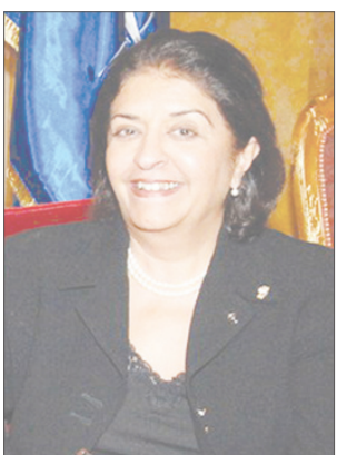
نبيلة الملا سفيرة دولة الكويت

مراقبتها". وحسب السفيرة دولة الكويت لدى بلجيكا والاتحاد الأوروبي نبيلة الملا ان دول مجلس التعاون لدول الخليج العربية تبدي كغيرها من الدول اهتماما باستخدام الطاقة النووية في الأغراض السلمية. وأوضحت السفيرة الملا في مقابلة خاصة مع وكالة الأنباء الكويتية (كونا) بالعاصمة برلين انها أكدت هذا التوجه من قبل دول مجلس التعاون خلال المحاضرة التي ألقاها في ندوة حلف شمال الأطلسي (ناتو) الرابعة التي تستضيفها وزارة الخارجية الألمانية بالتعاون مع حلف (ناتو) حول اسلحة الدمار الشامل.