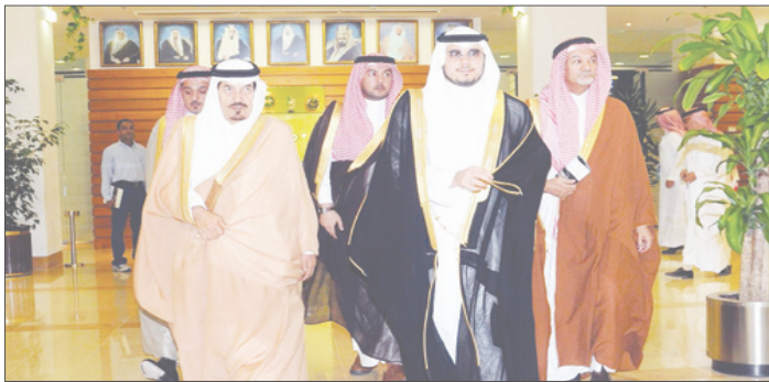
الأمير الوليد يحضر سباق الخيل

من الزمان على تقديم مكافآت تشجيعية لأبطالها، ففي كل عام يقدم سموه مالا يقل عن 5 سيارات كجوائز للفائزين بالسباقات إضافة إلى مبالغ مالية تشجيعية من سموه لهذه الرياضة العربية الأصيلة. ومن المعروف أن هذا التكرم ليس بالعرف على الأمير الوليد، فقدم سموه السخي لأصحاب الإنجازات من الاتحادات والأندية الرياضية على المستوى الوطني والقاري أصبح حدث أسبوعي منذ عدة سنوات.