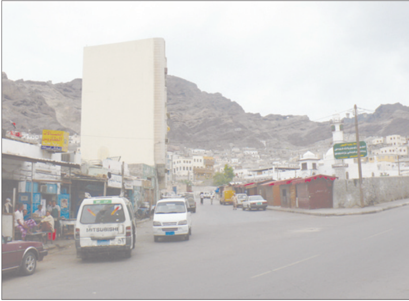
مسقط مجاري السيول من جبل العيدروس