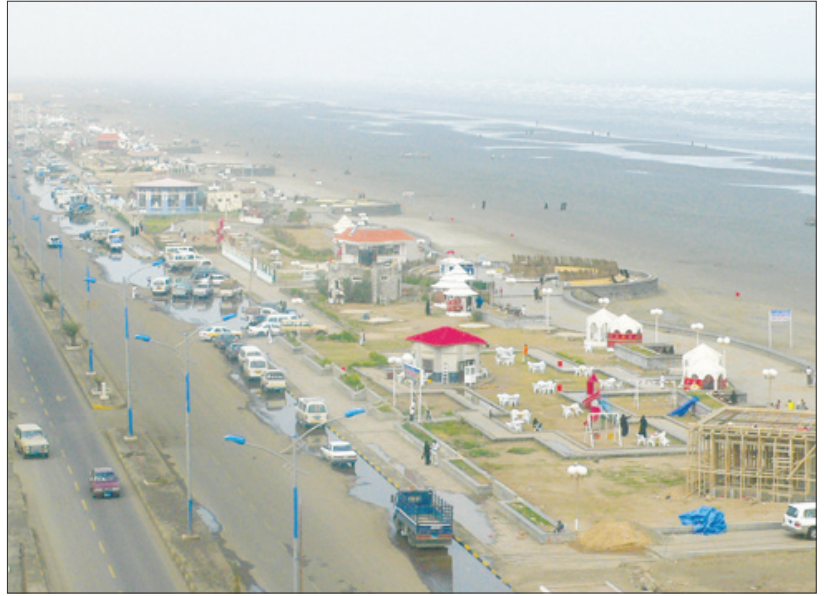
خورمكسر ليلة العاصفة