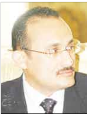
د. خالد إبراهيم وزير النقل

بأله. وأخر اتفاق معكم ظهر يوم 2008/ 11 /16م بان تعودوا للعمل بدون توقيع أي اتفاقية حتى ينظر في التعديل فيها وكان ذلك بحضور الإخوة المحافظ ومدير الأمن ووكيل الوزارة ورئيس نقابة النقل وللأسف لم تلتمزوا. إخواني العمال والموظفون إنكم لم تتركوا لأحد طريقاً آخر وتتمتعون بمسؤولية ما جنته أيديكم ولا يمكن للوزارة أن تسمح بإيقاف عمل تعطيل عمل المحطة ولن تسمح بتشويه سمعة ميناء عدن واعتباراً من يوم الاثنين المؤرخ 17 نوفمبر 2008م وفي تمام الساعة الثانية عشر ظهرًا ليس للوزارة أو أحد منتسبيها أي علاقة بموضوع عمك كون الشركة المديرة للمحطة لها إتخاذ كافة إجراءاتها لما يكفل التشغيل الكفء للمحطة ولهم الحق في توقيع عقود جديدة واستحلاب عمال جدد بموجب إشعارهم الصادر في تمام الساعة الخامسة من عصر يوم الأحد الموافق 2008/11/16م والذي أكدت فيه أنها ستقوم بإبرام عقود جديدة ابتداءً من الساعة 12 ظهرًا من يوم الاثنين الموافق 2008/11/17م وان الباب مازال مفتوحاً لحضور العمال السابقين ومزاولة عملهم ما بين الساعة الثامنة صباحاً وحتى الساعة الثانية عشرة ظهرًا... وبموجب هذه المذكرة يمكنكم العودة للعمل.