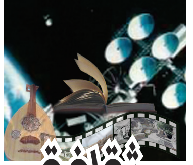
إعداد/ جلال أحمد سعيد

أعلنت لجنة تحكيم الجائزة العالمية للرواية العربية «البوكر العربية» لسنة 2009 يوم أمس الثلاثاء 11 من نوفمبر، ترشح الروائي اليمني علي المقري للقاومة الأولية لجائزة البوكر العربية عن روايته «طعم أسود .. رائحة سوداء» الصادرة عن دار الساقي، اختيرت اللائحة الطويلة، 16 كتاباً - من أصل 121 عملاً تأهلت للمشاركة. ووفق بلاغ صحفي تلقاه فقد تولت اختيار اللائحة الطويلة لجنة تحكيم مؤلفة من خمسة أعضاء من العالم العربي وأوروبا. وسوف تعلن أسماء أعضاء لجنة التحكيم عند إعلان اللائحة القصيرة، في العاشر من كانون الأول 2008، مثلما تقتضي شروط الجائزة. وقال جوناثان تايلور الذي يرأس مجلس الأمناء، تعليقا على اللائحة الأولية: «تظهر اللائحة مدى تنوع الأدب العربي وجودته. إن هذا الأدب يستحق جهوراً أوسع، ومن المفترض أن تساهم الجائزة في تأمين