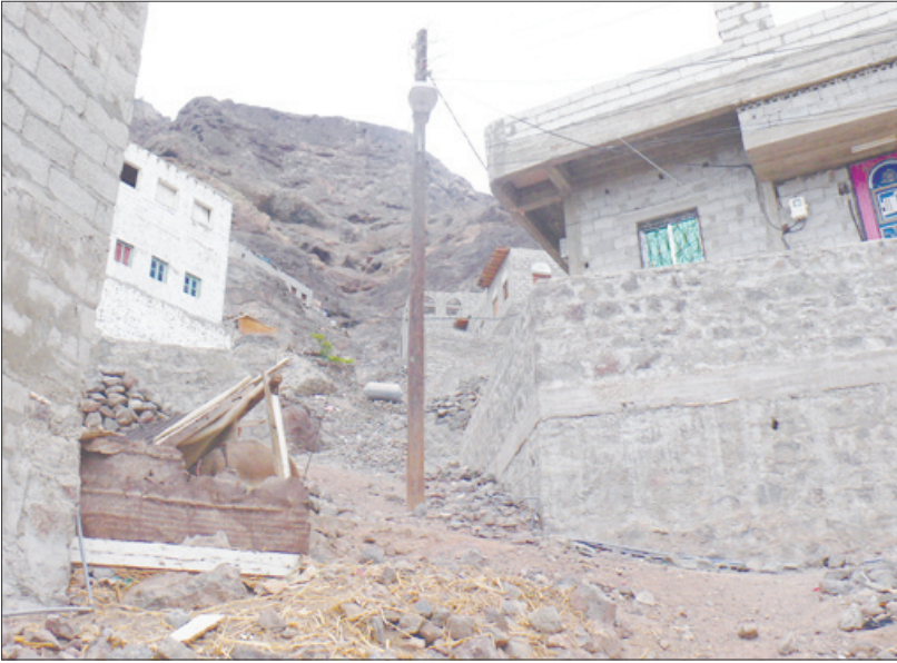
العشوائيات في مجرى السيول ويبدو عمود الكهرباء هو الآخر يتحدى