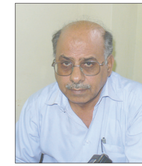
الشيخ محمد علي الكازمي