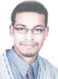
الشاعر المصري / إسلام هجرس

كثيراً ما أنادي ورغم نداي أنكري وحين أومني بالصمت يعتذر المدى عني فأقبلي وأعقد موقفاً بيني وبينه أن أجاهدني فقد يمدّ حبل الوصل من زوجي إلى زوجي ومن بدني إلى بدني أسأبني إلى فهمي فأفهمني ، وأجهلي ! أنأفسي على كسبي فأكسبني ، وأخسرتني