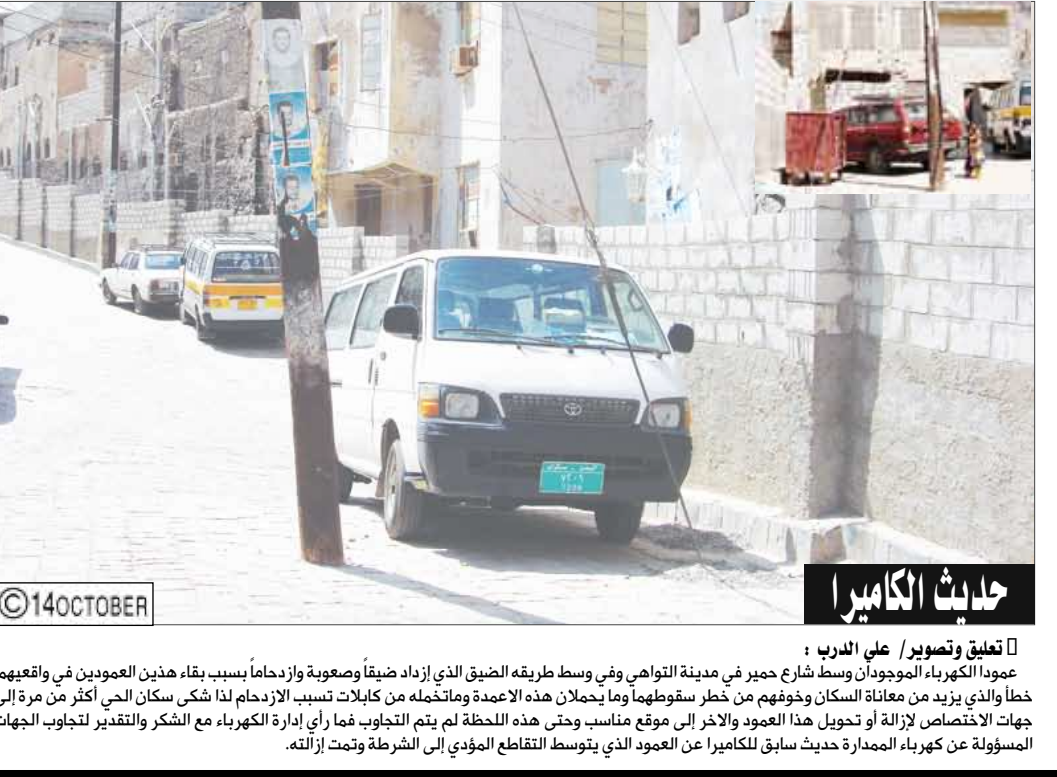
حدث الكاميرا □ تعليق وتصوير / علم الرب : عود الكهرياء الموهودان وسط شارع حجير في مدينة التواهي وفي وسط طريقه الضيق الذي إزداد ضيقاً وصعوبة وازدحاماً بسبب بقاء هذين العمودين في واقعهما خطأ والذي يزيد من معاناة السكان وخوفهم من خطر سقوطها وما يحملان هذه الأعمدة وما تخله من كبلات تسبب الإزدحام لذا شكى سكان الحي أكثر من مرة إلى جهات الاختصاص لإزالة أو تحويل هذا العمود والآخر إلى موقع مناسب وحتى هذه اللحظة لم يتم التجاوب فما رأي إدارة الكهرياء مع الشكر والتقدير لتجاوب الجهات المسؤولة عن كهرياء العمارة حدث سابق للكاميرا عن العمود الذي يتوسط التقاطع المؤدي إلى الشرطة وتمت إزلاته.