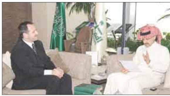
الأمير الوليد بن طلال لدى استقباله سفير البوسنة والهرسك

وفي نهاية اللقاء ودع سمو الأمير السفير محملاً بإياه تحيات البوسنة والهرسك حكومة وشعباً. وقد سبق أن تبرع الأمير الوليد للبوسنة والهرسك عام 1992 حين قدم مليون ريال سعودي لدعم الشعب البوسني، وتبع ذلك تبرع آخر قدره 10 ملايين ريال سعودي عام 1993 و20 مليون ريال سعودي في عام 1995. وفي عام 2003، قام الأمير الوليد بزيارة رسمية للبوسنة والهرسك التقى خلالها بفخامة الرئيس السابق السيد سليمان تيهيتش الذي قدّمه سموه الوسام الرئاسي، وهو أعلى وسام يمنح في البوسنة والهرسك.