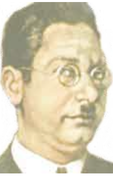
الشاعر زكي مبارك