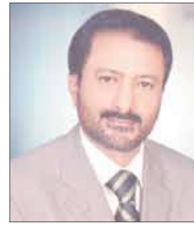
■ فارس السقاف

احتفاء بأعياد الثورة اليمنية الخالدة 26 سبتمبر والـ 14 أكتوبر وتحت رعاية فخامة الأخ علي عبد الله صالح - رئيس الجمهورية راعي الأدب والثقافة في الوطن اليمني يفتتح يوم غد الأربعاء المعرض الـ 25 للكتاب تنظمه الهيئة العامة للكتاب بمشاركة 300 دور نشر محلي وعربي وأجنبي وبهذه المناسبة أجرت الصحيفة لقاء مع الأستاذ الدكتور فارس السقاف - رئيس الهيئة العامة للكتاب أستعرض فيه الجهود المبذولة للتحضير لهذا المعرض والدور الذي اضطلعت به الهيئة منذ توليها مهمة الإعداد والتحضير له منذ أربعة أعوام مضت وجملة القضايا والموضوعات المتصلة بدور الكتاب في تعزيز الثقافة الوطنية وطموحات الهيئة والحصيلة في الأتي :-