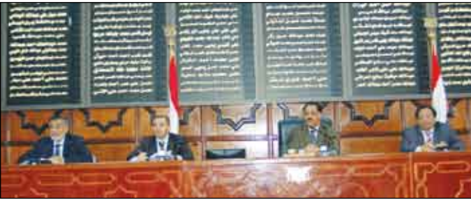
صنعاء / سبأ :

أقر مجلس النواب في جلسته المنعقدة أمس برئاسة رئيس المجلس يحيى علي الراعي ان يدرج في جدول أعماله تقرير اللجنة المشتركة من لجنتي الخدمات والتنمية والنهوض حول اتفاقية القرض الفرنسي لتمويل مشروع منظومة المراقبة والتحكم (إسكادا) لمركز التحكم الوطني ومراكز التحكم المحلية البرمجة بين اليمن والوكالة الفرنسية للتنمية بـ 26 مليوناً يورو أي ما يعادل 36 مليون و700 ألف دولار أمريكي، وكذا تقرير لجنة التربة والتعليم حول المعلمين المنقولين من محافظات صنعاء، الحوف والبيضاء إلى محافظات أخرى وقضية الموجهين التربويين.