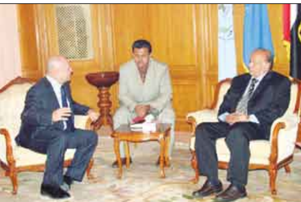
صنعاء / سبأ :