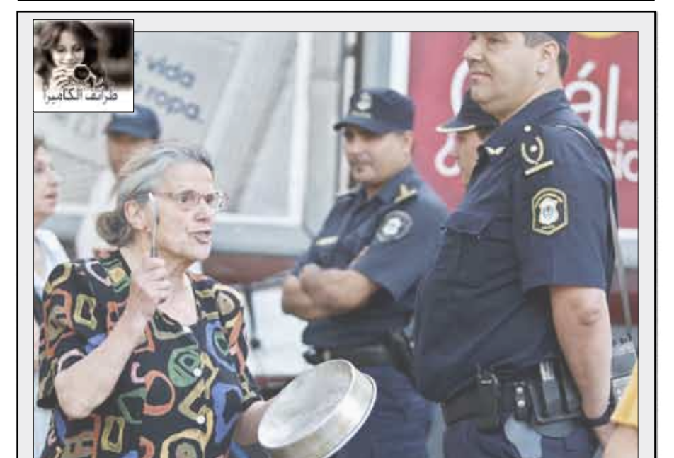
بالحلة والمعلقة تعبر هذه السيدة الأرجنتينية عن احتجاجها

مازالت قصة اللص البريطاني الشريف روبن هود تؤثر على عقول البريطانيين ذلك اللص الشريف الذي كان ينتمي لعائلة محترمة لكنه لأسباب سياسية وميدانية أنشأ عصابة شهيرة تسلب الأغنياء لتعطي الفقراء. فعلى ما يبدو أن اللصوص الشرفاء لم يخفوا تماماً من الجزر البريطانية بدليل تسجيل واقعة طريفة بطلها لص شريف، تاب سنوات على حادثة السرقة. فقد نقلت صحيفة «الشرق الأوسط» عن صحيفة «ويسترن ديلي برس» الإقليمية البريطانية الصادرة في جنوب غربي إنجلترا أن اللص سرق قبل ثمانين سنة كمية من السجائر من أحد متاجر مدينة بريستول، لكنه بعد مرور هذه المدة غير القصيرة دم على ما أقره، فقرر الاعتذار عن فعلته، وأرقد بخطاب الاعتذار الذي أرسله إلى التاجر