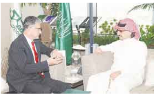
الأمير الوليد بن طلال لدى استقباله السفير الألباني

هذا وأعرب الأمير الوليد عن امتنانه بهذه الثقة التي يفتخر بها، ووعد بدراسة الفرص المتاحة في مجال الفنادق، والإطلاق على المواقع الإستراتيجية الهامة لإقامة الفنادق والمنتجات السياحية هناك. ووجه سموه الجهة المختصة في شركة المملكة القابضة لدراسة المشاريع والفرص الإستثمارية المتوفرة في الوقت الحالي، وتحديد الجدوى الاقتصادية لهذه المشاريع وتقديم نتائجها لسموه لبحث محتواها مع حكومة ألبانيا. وقبل نهاية اللقاء، أكد الأمير الوليد حرصه على الاستثمار في ألبانيا وتقديم ما يوسعها لدعم العلاقات المشتركة وقدم تمنياته الحارة لحكومة وشعب ألبانيا بالازدهار والرخاء.