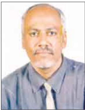
د/عبدالله صالح باشرحيل

مرت شهور على نجاح عملية انتخاب المحافظين عبر المجالس المحلية، واعتقد أن محافظة عدن قد تكون الوحيدة التي حظيت برجل تقلد 3 مناصب وزارية ابتداء بالعدل والشؤون القانونية، ثم شؤون مجلس النواب والشورى بالإضافة إلى كونه عضواً منتخبا في مجلس النواب ولهذا أقول إن مهامه كبيرة وخبرته السياسية والتنفيذية لا تحتاج إلى وصف كما أن آمال وأحلام أبناء عدن مازالت تنتظر التحقيق وتحويلها إلى واقع وإنجازات ملموسة. وليسمح الدكتور عدنان أن أطره عليه بعض الملاحظات أو ((الأحلام)) التي تتوقّعها وتتطلبها محافظتنا ((الحضن الدافئ لكل أبناء الوطن اليمني)).