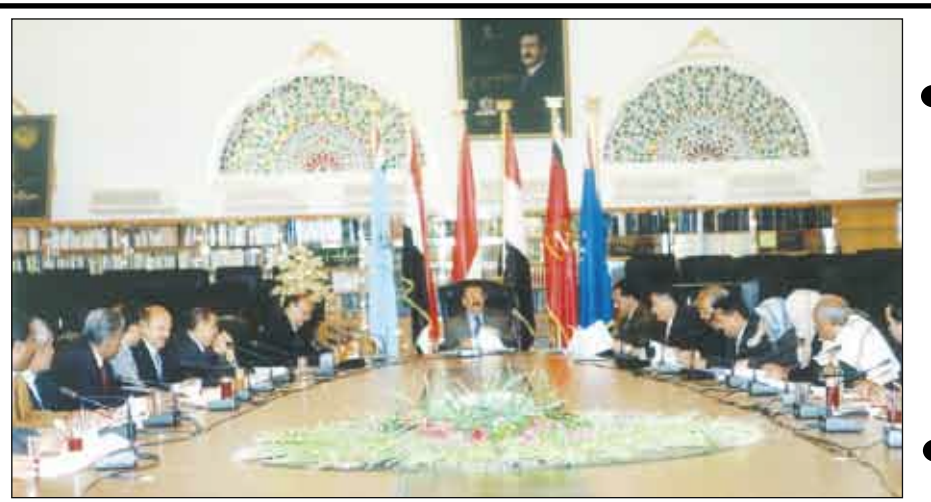
صنعاء / 14 أكتوبر / مناجيات :

أكدت اللجنة العامة للمؤتمر الشعبي العام على أهمية الدور الذي ينبغي أن يضطلع به الأخوة أعضاء المؤتمر وكوادره وأنصاره في التعامل الإيجابي مع الانتخابات النيابية القادمة باعتبارها مستحقاً ديمقراطياً وديمقراطياً هاماً وجوهراً العملية الديمقراطية التي ينبغي أن تتصافى كل الجهود لإنجاحها ومن أجل المزيد من تعزيز الديمقراطية. وفي الاجتماع الذي عقده أمس برئاسة فخامة الأخ الرئيس علي عبدالله صالح ، رئيس الجمهورية ، رئيس المؤتمر الشعبي العام ووقفت خلاله أمام العديد من التطورات على الساحة الوطنية ، أكدت اللجنة العامة الحرص على مد جسور الحوار مع الجميع في الساحة الوطنية على أساس الالتزام بالتوازي الوطنية وإثراء واقع الممارسة الديمقراطية والتعددية واحترام الدستور والقوانين النافذة وتحقيق المصالح الوطنية العليا. وتناقشت اللجنة العامة في اجتماعها العديد من القضايا والموضوعات التنظيمية المدرجة على جدول أعمالها ومنها التحضيرات الخاصة بالاجتماع الاستثنائي للجنة الدائمة للمؤتمر الشعبي العام المقرر عقده يوم الأربعاء المقبل بالعاصمة صنعاء ، وكذا التحضيرات الخاصة بانعقاد الدورة الثانية للمؤتمر العام السابع للمؤتمر الشعبي العام والمقرر انعقادها خلال الفترة القادمة..