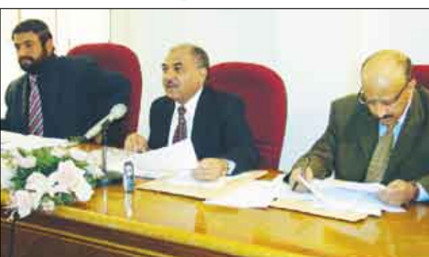
صنعاء / رمزي العزمي :

أكد الأخ حسين اللوزي - وزير الإعلام على أهمية الالتزام الدقيق بتنفيذ السياسة الإعلامية التي تقودها اللجنة العليا للانتخابات والاستفتاء ، فيما يتعلق بالإجراءات والخطوات المنفذة لإجراء الانتخابات العامة للسلطة التشريعية (راجع ص 5). وقال في كلمة ألقاها صباح أمس لدى ترؤسه اجتماع اللجنة العليا للتخطيط البرامجي بديوان عام الوزارة أن على وسائل الإعلام إعطاء عناية خاصة هذه الأيام لمرحلة القيد والتسجيل وتصحيح سجلات الناخبين وتحريض المواطنين جميعهم على سرعة التوجه للمراكز المخصصة في دوائرهم الانتخابية من أجل قطع الطائفة الانتخابية وأن على كل من بلغ السن القانونية وهي الثامنة عشرة أن تكرر أو أتى عليهم الإسراع بقطع بطاقة الانتخابية باعتبارها حقاً وسبباً للممارسة الديمقراطية. وأشار إلى أن اجتماع اللجنة العليا للتخطيط البرمجي يأتي ويلاندا على