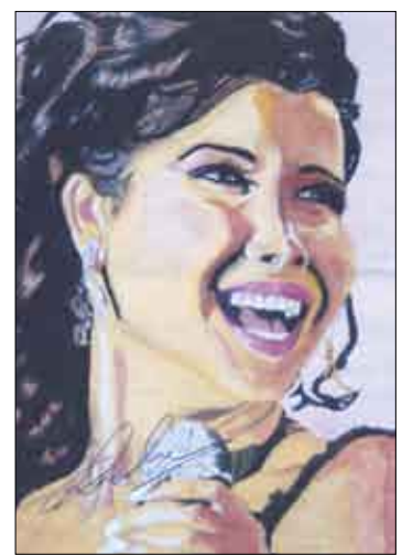
الفنانة انانسي عجم (بورتريه)