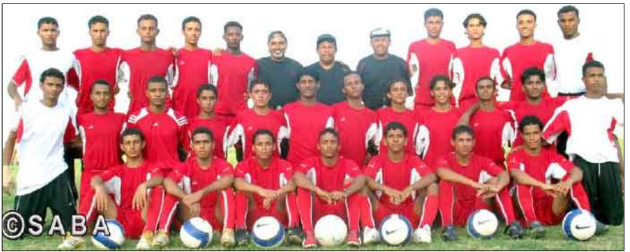
منتخبنا الوطني للشباب