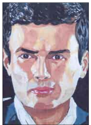
الفنان عمرو دياب (بورتريه)