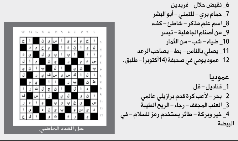
حل العدد الماضي

5_ شقيقي - عاصمة بنما 6_ مدينة إماراتية - متشابهان - قرض أو دين 7_ رحيل - أداة حصر - من الثمار 8_ عاصمة عربية - لبس 9_ أبو الأب - عاتب 10_ إحدى القارات - ننفخ 11_ من أقسام الجسم - عاصمة أوروبية - فرح وسرور 12_ شتم (معكوسة) - والدة - جمهورية وجزيرة في المحيط الهندي.