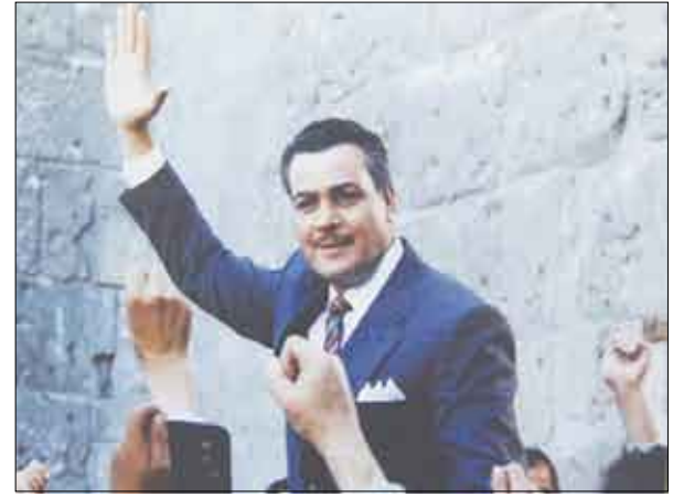
مشهد من مسلسل ناصر

دونما تمثيل ، ومجدي يرتفع عبر عمق التناول الدرامي في النص وتفصيله لأجمل وأفضل أداء وحس بالشخصية ليصبح وثيقة ستظل في التاريخ، كما