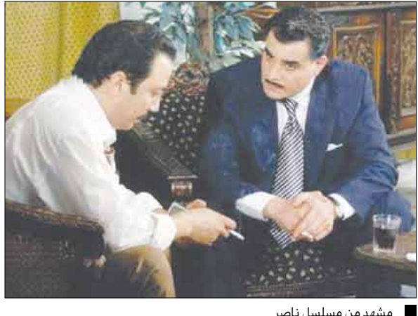
مشهد من مسلسل ناصر