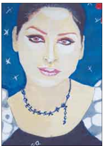
الفنانة اليسا (بورتريه)

الرئيس علي عبدالله صالح أن يرجم الأبناء ويخفف معاناتهم حتى نستطيع التفوق والنجاح وما أعلن قيادة جامعة عدن ستحول دون إلغاء الرسوم أو تخفيفها