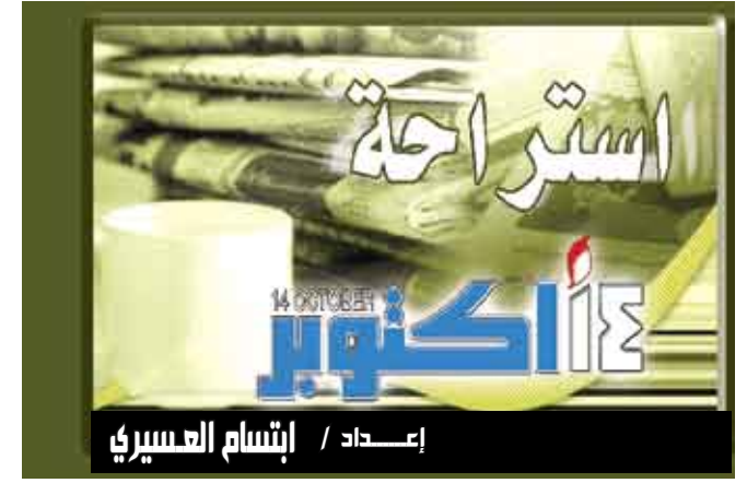
إعداد / إنشام العسيري

ويتمتع جهاز نوكيا 8800 كاربون آرت بميزة فريدة تدعى «معرفة الوقت بالنقر على الجهاز»، تمكن المستخدم من معرفة الوقت عبر النقر المزوج على السطح الفولاذي من خلال الساعة التي تظهر على الشاشة. كما يوفر الجهاز إمكانيات وضع خلفيات مصورة تتغير على مدار اليوم. بالإضافة إلى ذلك، يتميز الجهاز بخاصية إسكات المكالمات الواردة بطريقة لا يشعر بها المحيطون عبر حركة بسيطة وهي قلب الجهاز بحيث تصبح شاشته إلى الأسفل.