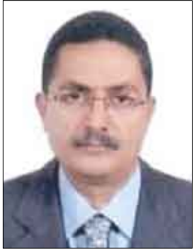
د. أحمد علي بورجي

والصعوبات والمعوقات التي قد تواجه سير تنفيذها ، بالإضافة إلى مناقشة قرار المجلس الوطني للسكان بشأن تمويل هذه الخطة . بدوره مدير عام الإعلام والتوعية السكانية بالأمانة العامة للمجلس الوطني للسكان مقرر اللجنة الأعمى مجاهد أحمد الشعب قام بتقديم شرح واضح ومفصل للمحاور والبنود الأساسية التي تضمنتها استمارة جمع المعلومات الخاصة بأنشطة الجهات التنفيذية للإستراتيجية الوطنية للإعلام السكاني ، والتي تم إعدادها وتصميمها من قبل مركز المعلومات التابع للأمانة العامة للمجلس . هذا وقد خرج الاجتماع بعدد من النتائج والتوصيات التي من شأنها تعزيز دور اللجنة في مجال التوعية السكانية . حضر الاجتماع الأعمى بونس هزاع - وكيل وزارة الإعلام المساعد المدير التنفيذي للبرنامج العام للإعلام والاتصال السكاني - نائب رئيس اللجنة