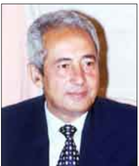
العديد / سبأ

جرى أمس بالحديدة توزيع المساعدات المالية والعينية التي وجه بها فخامة رئيس الجمهورية خلال لقائه صباح أمس بقيادة وأعضاء المكاتب التنفيذية والمجالس المحلية بالمحافظة والمقدمة من المؤسسة الاقتصادية اليمنية ومؤسسة خليفة بن زايد الخيرية بدولة الإمارات العربية المتحدة للمتضررين من جراء الأمطار التي هطلت على مديرتي باجل ..