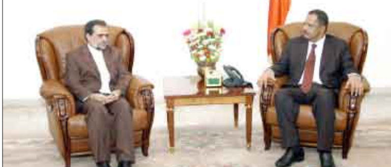
لرئيس الإيراني الدكتور مجور وتمنياته له بوفور الصحة والسعادة وللشعب اليمني دوام التقدم والتطور، وللعلاقات الثنائية المزيد من العمل المشترك والتعاون المثمر في كافة المجالات. وجرى مناقشة العلاقات الأخوية بين البلدين الشقيقين وما تشهده من تواصل