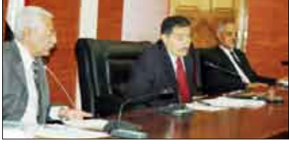
صنعاء / سبأ

دان مجلس الشورى بشدة الاعتداء الجوي الذي نفذته قوات الاحتلال الأمريكي في العراق على منطقة البوكمال الحدودية السورية ووصفه بالانتهاك الصارخ لسيادة بلد عربي عضو في الجامعة العربية وهيئة الأمم المتحدة.