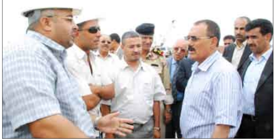
العديد / سبأ

ثمن فخامة الأخ الرئيس علي عبدالله صالح ، رئيس الجمهورية عليا تجاوب كل أبناء الوطن الذين هبوا لإغاثة إخوانهم في حضرموت والمهرة ، وقال: " إن هذا يؤكد الأخوة الصادقة والمحبة كما ان تسابق أبناء الوطن على نجدة إخوانهم المتضررين هو عمل يعتز به كل يمني وتجسيد صادق لمعاني الوحدة الوطنية وهي نعمة من الخالق عز وجل".