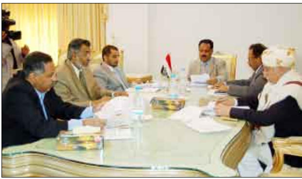
وأما هيئة رئاسة مجلس النواب بجماهير الشعب والمؤسسات والجمعيات الخيرية مواصلة تقديم المساعدات والمعونات بكل سخاء