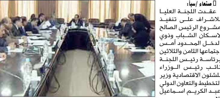
تتمكن من تجاوز أي معضلات. كما استعرضت اللجنة تقرير مجموعة التنسيق المتعلقة بخلاصة آلية دراسة الجدوى للمشاركة الاسكانية الاستثمارية حيث اقرت اللجنة التوقيع مع الشركة المتخصصة باعداد دراسة الجدوى والتسريع بإنجازها.