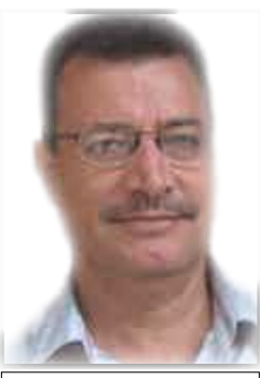
الشاعر السوري بيان الصفي

بسيوف مكسورة ومخالب محذبة يمسكون بشرك الجميل وفوق صفحات التاريخ يدوسون بحوافهم الثقيلة ومن كل قطرة دم عزشت دالية الغضب وأنت ملقاة في قلب الليل كسما ذات نجوم كنبح من قلب الجبل كشعلة في كهف تحملين وسام القبلة وغريزة الشلال وبقوة الموت والحياة تترين أيتها المرأة على كلمة الحب