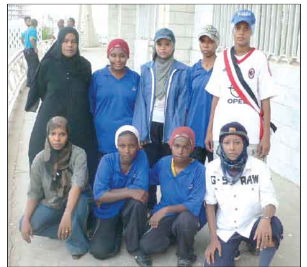
ملاكمات عدن من الارشيف