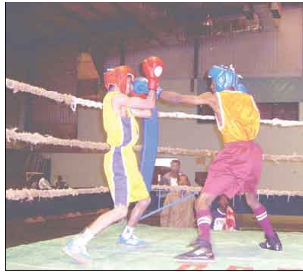
لقطة ملاكمة من الارشيف