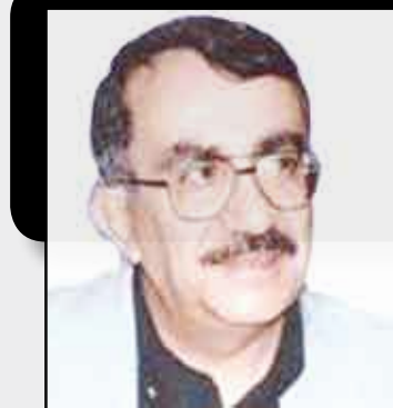
د. تركي الحمد

النتيجة أن خسرت معارك الحرب بعد أن فاتها الاسهام في معركة الحضارة ، ولم يظهر عليها انها استوعبت الأبعاد الكاملة لأزمته التاريخية بعد تلك الهزائم إذ لم تقدم