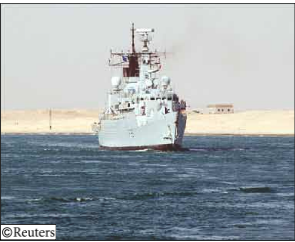
سفن حربية ترابق القراصنة الصومال