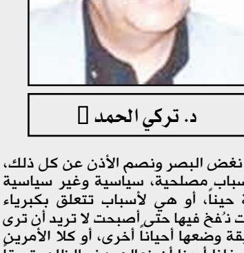
د. تركي الحمد

في النهاية يُصَب في العقل العربي بمختلف الوسائل ، هو معاداة الآخر ، والآخر الغربي بشكل خاص . لقنا ذلك في ممارسنا ومساجدنا وجامعاتنا وأنديتنا ووسائل إعلامنا ، فهل من العجيب أن لا نشأ ونحن ننظر إلى العالم من حولنا نظرة شك وريبة وعدم ثقة؟ يضاف إلى ذلك كله أن هذا الخطاب اختزل كل البيات الآخر المعادي «الاستعمار أو الصليبية أو الإمبريالية» لإخضاعنا في الية مستديمة واحدة ألا وهي المؤامرة ، فهذا العدو لا يكمل ولا يمل من التآمر علينا خاصة ، لأهمية ديارنا في مقابل كل ديار العالم ، فلدنيا النفط وكل تلك الثروات الهائلة ، ولدنيا الموقع المتوسط الفريد ، ولدنيا فوق ذلك العالم كله ، فلعالم ، وتعيد العالم إلى الأمة التي هي خير الأمم ، كما هو منطق الإسلاموية المعاصرة . كل هذا النفخ المبالغ فيه في الذات ، جعلنا نتوهم ، أو نصاب بقوبيا شنيعة من أن كل شيء حولنا يتآمر علينا ، فلا نثق بأحد ولا يثق بنا أحد بالتالي ، فينبغ من ذلك كله أيديولوجيات على مختلف الأنواع ، وحسب مختلف الظروف والمراحل ، التي تدعو إلى تدمير هذا المتربص بنا دوماً ، فتجد الكثيرين ممن يؤمن بها دون فعل ، ولكنها في النهاية تجد من يؤمن بها بفعل ، وهنا ينغبر الإرهاب في حالتنا . الإرهاب ليس وليدًا يتيماً أو عديم الأب والأم ، بقدر ما أنه نتيجة لمقدمات كانت تحاول الإضمار عن نفسها في كل حين ، ولكنها