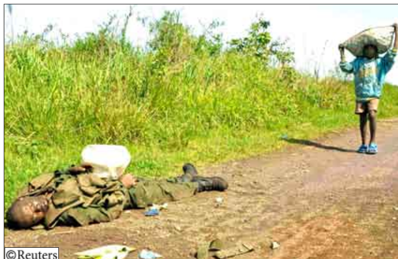
بعض جنث المتطرفين في الكونجو

باريس «الهدف الأول هو توصيل رسالة سياسية واضحة من أوروبا بأنه لا بد من الحفاظ على الاستقرار وأنه يتعين على اللابيين الذين توجد بينهم خلافات سياسية أن يتحدوا مع بعضهم، وأضاف أن وزير الخارجية الفرنسي والبريطاني سيجريان أيضاً تقييماً لوضع السكان المدنيين وأمنهم. وقال الأمين العام للأمم المتحدة بان كي مون أمس الأربعاء إنه لا بد من الالتزام بوقف إطلاق النار. وضغط مبعوثون دبلوماسيون أوروبيون وأمريكيون على جيران الكونجو ورواندا في منطقة أكثر منها عنصرية. و جرى نشر قوة لحفظ السلام تابعة للأمم