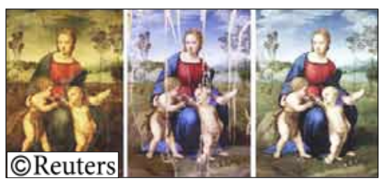
ثلاث لقطات منفصلة وغير مفرقة لوحة رافاييل العذراء وطلائر الحسون.

14 أكتوبر/رويترز تعود لوحة من أعظم روائع عصر النهضة الإيطالية للعرض بعد 10 سنوات من الدراسة وأعمال الترميم المضنية التي اختبرت كلا من أحدث التقنيات والصبير البشري. وتصور لوحة رافاييل التي تدعى «العذراء وطلائر الحسون» مريم العذراء بصحبة طفلين يملآن يسوع المسيح ويوحنا المعمدان وهما يلاطغان طائر الحسون الذي يرمز إلى آلام المسيح فيما بعد لأن الحسون يحصل على طعامه من بين الأشواك.