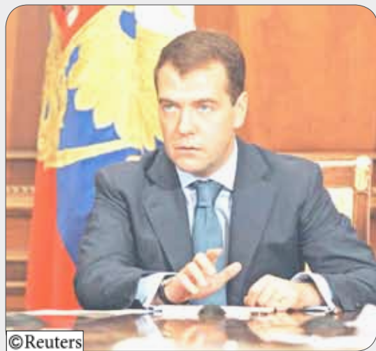
الرئيس الروسي دميتري ميدفيديف

14 أكتوبر/واشنطن/رويترز: قال الرئيس الروسي دميتري ميدفيديف أمس الجمعة إنه سيلعب دوراً رئيسياً في إصلاح النظام المالي العالمي، مؤكداً أن إصلاح النظام المالي العالمي هو أولوية قصوى لبلاده.