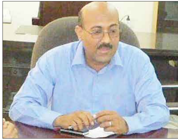
عبدن / 14 أكتوبر: