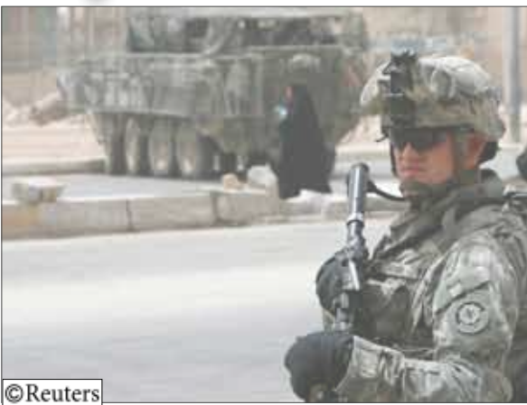
جندي امريكي يراقب احد شوارع بغداد