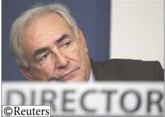
مدير صندوق النقد الدولي دومينيك ستراوس يتحدث خلال اجتماع في واشنطن يوم 13 أكتوبر 2008

تحقيق يبرق مدير صندوق النقد الدولي في مسأله علاقته مع رؤوسه