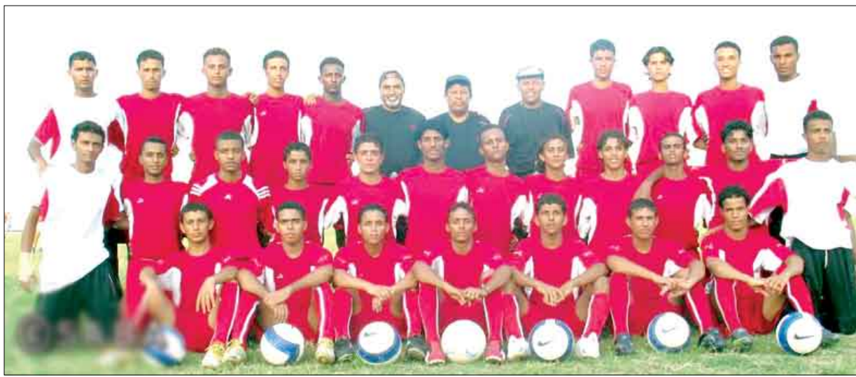
الدمام / سبأ:

وقدم المنتخب اليمني أداء سيئاً في المباراة ، اتسم بالكثير من الأخطاء الدفاعية التي سمحت لمهاجمي اليابان بتسجيل الأهداف الخمسة ، منها ثلاثة في أقل من خمس دقائق ، فيما بدأ واضحا ضعفه في الدفاع ، وإن تحسن الأداء كثيراً بعد الأهداف الخمسة وكثرت المحاولات لتقليص الفارق أمام دفاع ياباني قوي ومراقبة لصيقة لمهاجمينا . وبهذه النتيجة يحصد المنتخب الياباني أول ثلاث نقاط له في المجموعة الأولى التي تضم أيضا منتخب السعودية المستضيف وإيران ، فيما خرج المنتخب اليمني خالي الوفاض بانتظار