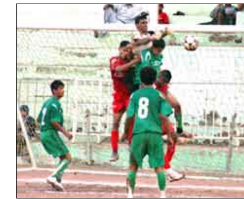
وشمسان التي ستقام اليوم الاثنين على نفس الملعب.