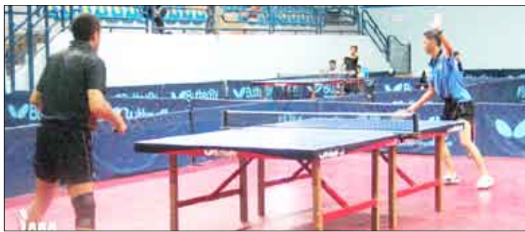
الأهلي والصقر فئة الكبار