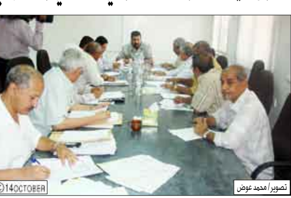
صنعاء / سبأ

صنعاء / سبأ: استعرض مجلس إدارة المؤسسة المحلية للمياه والصرف الصحي بمحافظة عدن في اجتماعه أمس برئاسة الدكتور عدنان عمر الجفري محافظ محافظة عدن رئيس مجلس الإدارة تقريراً عن حقول المياه في كل من محافظت عدن وأبين ولحج وكيفية حمايتها من التلوث والسطح والحفر العشوائي. واطلع المجلس على الأضرار البيئية المحققة بحقول المياه التي تغذي محافظة عدن في كل من بئر ناصر والروة بمحافظة أبين وبئر أحمد بمحافظة عدن وجهود إدارة المؤسسة في الحفاظ على سلامة هذه الحقول من الزحف العشوائي السكاني والعمراني باعتبارها أكثر المشاكل التي تواجه المؤسسة خلال الأعوام السابقة والحالية. وتطرقت التقرير إلى الإجراءات التي تم اتخاذها من خلال توقيف صرف عدادات المياه للمواقع القريبة من الحقل حسب قرار مجلس الوزراء