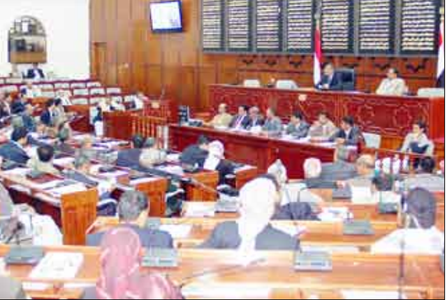
صنعاء / سبأ

صنعاء / سبأ: حث نواب الشعب الحكومة على إدراج تكاليف الأضرار الناتجة عن كارثة الأمطار والسيول في محافظتي المهرة وحضرموت بالمنطقة الشرقية، ضمن مشروع قانون فتح اعتماد إضافي للموازنة العامة للدولة للعام المالي 2008م. وفي الجلسة التي عقدها مجلس النواب أمس برئاسة الأخ محمد علي الشدادي، نائب رئيس المجلس، أقر النواب التبرع بقسط يوم واحد من مخصصهم الشهري لصالح المتضررين جراء الكارثة، مؤكداً ضرورة تفعيل نشاط صندوق مواجهة الكوارث الطبيعية. ودعا نواب الشعب إلى تضافر الجهود الرسمية والشعبية في سبيل متابعة أعمال الإنقاذ والإغاثة وحصر الأضرار الناتجة عن تلك النكبة والكارثة الأليمة واتخاذ الإجراءات المناسبة لإيجاد المعالجات اللازمة لذلك، مشيداً بكل الجهود الطيبة التي تم بذلها في هذا الاتجاه حتى الآن. إلى ذلك واصل مجلس النواب مناقشته لمواد مشروع القانون البديل للقرار الجمهوري بالقانون رقم (39) لسنة 1991 م بشأن السجل العقاري بناءً على تقرير اللجنة المشتركة من لجنة الشؤون المالية