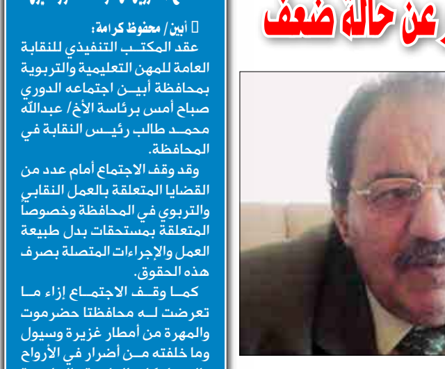
صنعاء / متابعات: