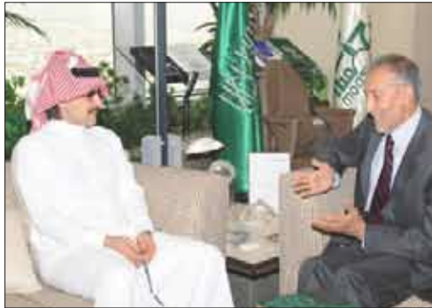
الأمير الوليد يستقبل السفير الأفغاني لدى المملكة العربية السعودية

ضرورة دعم النطاق التعليمي في البلاد لبناء مدارس جديدة أو إعادة ترميم المدارس القديمة. هذا وقد أكدت الأميرة أميرة أن مؤسسة المملكة التي يرأسها الأمير الوليد في أتم الاستعداد لدعم أفغانستان وشعبها، وأن المؤسسة ستقدم بجانب أفغانستان اليوم كما فعلت في السابق، ويعود دعم الأمير الوليد المتواصل للجوانب الإنسانية في أفغانستان إلى فترة الاستعمار السوفيتي.