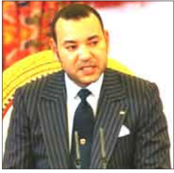
الملك محمد السادس

وطالب العاهل المغربي بضرورة إعادة تأهيل الرياضة المدرسية والجامعية «اعتباراً لدورها الريادي في الاكتشاف المبكر للمواهب وصلها». وختم محمد السادس رسالته بالقول «نحتمك على أن تجعلوا هذه المناظرة قوة اقتراحية تصدر عنها توصيات واقتراحات عملية تكون في مستوى التحديات التي تواجه رياضتنا الوطنية وتستجيب لتطلعات الجماهير الشعبية ومواطنينا في الداخل والخارج للمزيد من الانجازات والبطولات». وقالت نوال المتوكل وزيرة الشباب والرياضة في تصريح لرويتز «الرسالة الملكية كانت واضحة وهي بمثابة خارطة طريق لنا في السنين القريبة القادمة». واستمرت المناظرة الوطنية للرياضة أمس السبت بخمس ورشات عمل ليختتم اللقاء بتقديم المخططات وتشكيل اللجنة التي سيعهد إليها بمتابعة تنفيذ الأهداف.