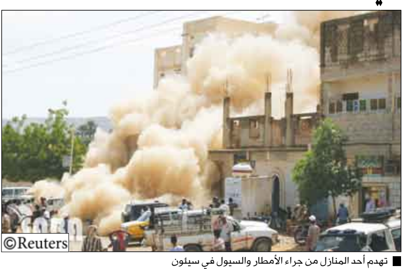
تهدم أحد المنازل من جراء الأمطار والسيول في سيئون

صنعاء / سيا : تلقى فخامة الرئيس علي عبد الله صالح رئيس الجمهورية أمس اتصالاً هاتفياً من أخيه جلاله الملك عبد الله الثاني ملك المملكة الأردنية الهاشمية الشقيقة عبر خلاله عن تعازيه في ضحايا كارثة السيول . وأعرب عن تضامن الأردن بقيادة وحكومة وشعباً مع شعبنا ووقوفهم إلى جانبه لمواجهة آثار هذه الكارثة . وعبر فخامة الأخ رئيس الجمهورية عن شكره وتقديره لما أبداه جلالته من مشاعر أخوية صادقة ، سائلاً الله أن يجنب الأردن الشقيق وكل البلدان العربية والإسلامية كل مكروه . كما تلقى فخامة الأخ الرئيس علي عبدالله صالح رئيس الجمهورية برقية عزاء من أخيه فخامة الرئيس زين العابدين بن علي رئيس الجمهورية التونسية في ضحايا فيضانات سيول الأمطار التي اجتاحت بعض مناطق جنوب شرق اليمن فيما يلي نصها : « على إثر الفيضانات التي اجتاحت بعض المناطق شرق اليمن الشقيق وما تسببت فيه من خسائر في الأرواح والممتلكات أتقدم إلى فخامتكم وإلى عائلات الضحايا باسمي وباسم