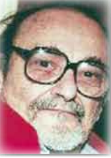
الشاعر اللبناني يوسف الخال

سراباً غداً مطلب وخيلاً من الغيب ويء جناح بطير ويهن في المهرب كان الزمان براه محللاً لبعث بي ويملأ نفسي احتضار الضياء لدى المغرب غدي، يا غدا الوهم والظن والامل المجدب سقيتك ذوب رجائي الوحيد فلم تشرب وخلت دنيا فتون تبع على ما عبي وتفرش دربي وروداً وترقص في مكوبي.