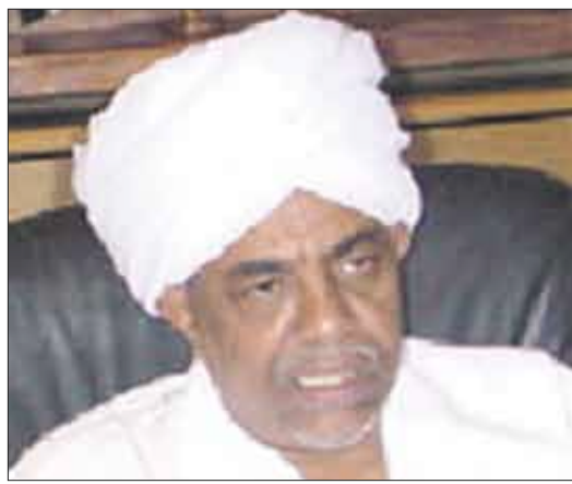
الرئيس عمر حسن البشير