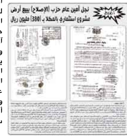
لجل أمين عام حزب الإصلاح ببيع أرض مشروع استثماري بالمكلا - 3800 مليون ريال

تري ما مدى مصداقية مطالبة رأس الإصلاح بإصلاح النظام السياسي؟ وهل هو بعيد عن السفسه الذي اتهمت به قيادة الحزب الحاكم أم أنه واحد منهم؟ ألا يفترض أن يبدأ الإنسان بإصلاح ذاته قبل مطالبته بإصلاح الآخرين؟ وكيف يمكن أن تتفق دعاوى الإصلاح مع حصول نجله على مليوني دولار من أرض قام ببيعها في مدينة المكلا سبق أن حصل عليها كمنحة من النظام؟ ألا يفترض أن يبني على تلك الأرض مجمع سكني أو مصنع أو مؤسسة إنتاجية يعتاش منها العاطلون والمعدمون واليؤساء من أبناء المكلا؟ وكيف سيقوى الرجل في حالة وصول حزبه إلى السلطة على محاربة السفسه الموجود في مؤسسات الدولة، في حين أنه لا يقوى على محاربة السفسه الموجود في داخل حزبه؟ لماذا لم يقدم الرجل على الضرب على نجله ويحول بينه وبين الحصول على أرض لا يستحقها، لئلا يسحقها، وهو يعلم أن الهدف من منحه إياها هو تحويل الابن إلى ورقة ضغط ومسالومة في يد المركز؟ ألا تدفعنا هذه الواقعة بالذات إلى وضع علامة استفهام حول حجم ومصدر ومشروعية ثروة رجل يجيز لنجله أن يحصل على مليوني دولار دون أن يبذل أي جهد أو يدفع أي مقابل؟ وما حكم هذا الكسب في إطار المبادئ والقيم والشعارات الدينية التي يصعد بها في وجوه الآخرين؟ ألا تفسر لنا هذه الواقعة حرص الرجل على المشاركة في العملية الانتخابية القادمة رغم علمه بأن المقاطعة باتت خيارا وحيدا لا سيما في حالة ميل غالبية المحافظات الجنوبية للمقاطعة؟ أليست المصلحة الذاتية وحدها للرجل الذي يتصدر قيادة أكبر حزب معارض تملئ عليه أن يضفي المشروعية بالمشاركة على النظام الذي تمطر سماؤه