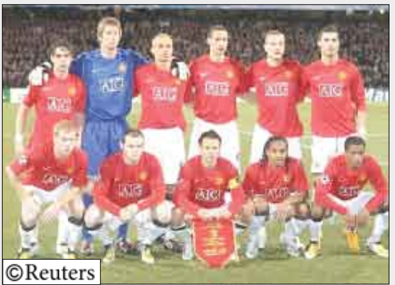
فريق مانشستر يونايتد