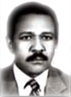
الشاعر السوداني / سيد أحمد الحردي

دائماً في الزحام حين يرتطم الوجه بالوجه والصوت بالصوت... يطلع وجهك عاصفة... من خلال الزحام!! فيزرعني في الشوارع... لغماً... ويغزو يقيني... ويدحرني... فألوذ إلى الصمت.. وهو كلام.. ... بأي اللغات.. أمارس حق التحية حق الرحيل... حق اللجوء إليك... وحق السلام.