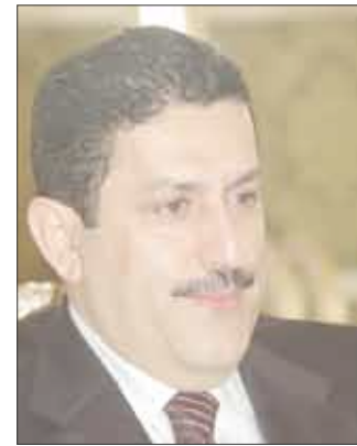
د. عبدالكريم راصع

انتخب الجمهورية اليمنية عضواً في الصندوق العالمي لمكافحة الإيدز والسل والملاريا لمدة ثلاث سنوات اعتباراً من العام القادم 2009م، وذلك في الدورة 55 للجنة الإقليمية للشرق المتوسط لمنظمة الصحة العالمية التي انعقدت في العاصمة المصرية القاهرة خلال الفترة 10 إلى 14 أكتوبر الجاري.