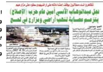
تفتقر هذه مقالين يوفى اعترافه على وجوده وطوره على مر الزمان