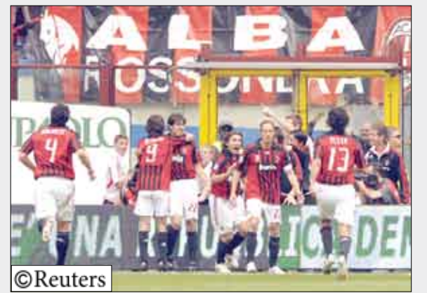
فريق ريال مدريد