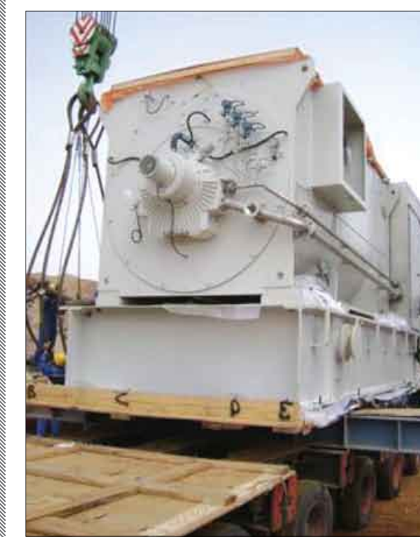
صنعاء / سبأ

نوفمبر القادم يليها عملية تحليل العروض بشكل كامل تمهيدا لإعلان عن الشركة الفائزة بالمشروع. يشار إلى أن وزارة الكهرباء والطاقة وفي إطار توجهات بالخطوات الأولى لمحطة مارب المرحلة الثانية من محطة مارب الغازية بقدرة 400 ميجاوات. حيث تسلمت لجنة المناقصات الفنية والبيئية ودراسة الجدوى الخاصة بمشروع محطة مارب الغازية بقدرة 400 ميجاوات. كما يجري العمل على إعداد الدراسات الفنية والبيئية ودراسة الجدوى وثائق المرحلة الثانية من المشروع . وخلال ذلك قال وزير الكهرباء والطاقة إن عملية التأهيل ستم عبر الشركة الاستشارية الألمانية فينتشر. .. مبينا أن بالاستثمار خلال السنوات القليلة القادمة .