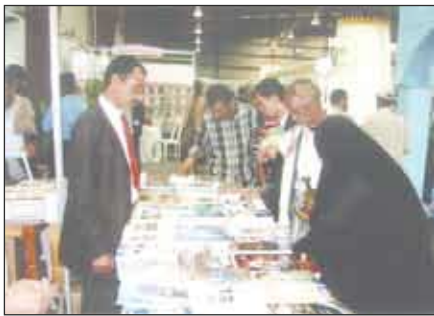
من معرض الكتاب

الدكتور عبدالله باوزير رئيس الهيئة العامة للأثار إلى أن دورة المعرض لهذا العام تشهد تميزاً كبيراً من حيث التنظيم والإعداد والارتفاع في عدد المشاركين من دور النشر وتتنوع الكتب في مختلف المعارف.