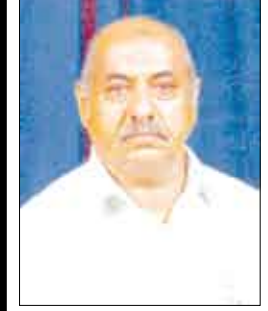
الشيخ الدكتور /