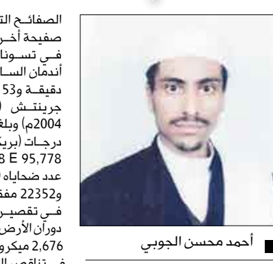
أحمد محسن الجوبي

14 أكتوبر: أوضح المفككي اليمني / أحمد محسن الجوبي مساء أمس أنه تلقى عدداً من الاتصالات من قناتة اليمن الفضائية ومن إذاعة عدن ومن إذاعات محلية ومن بعض الصحف أن هناك توقعات بحدوث زلزال مدمر سيضرب خليج عدن يوم 19 أكتوبر الجاري ويمنه تأثيره إلى السعودية. وأعلن الجوبي في تصريح لـ (14 أكتوبر) أنه لن يحدث أي زلزال لا في عدن ولا في غيرها. «وأطمئن أهل عدن ألا يخافوا ولا يقلقوا فهذه مجرد إشاعة منكرة، لا ترتكز على أساس علمي فالزلازل تحدث بسبب الحركات التكتونية لقشرة الأرض أو البركانية، وحركة الزلازل إما طولية وهي سريعة أو مستعرضة S أو ريلاي R أولوف Q وتحسب الطاقة المتحررة عن طريق التشووهات الذبذبية ومقياسها Richter SCALE والذي يرسم على TRACE بشكل SEISMOGRAPH، وأما مقياس مارييلي فيصك الخراب والتدمير، وحسابه هو (G A 310) = 1 (15) +. وتحدث الزلازل العنيفة حينما تفوق إحدى