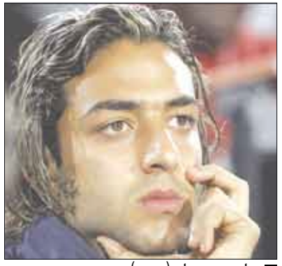
أحمد حسام (ميدو)

من جهته، أشار المدير الفني لميدو لسبب جاريث ساوثجيت إلى أنه شعر بخيبة أمل شديدة حينما تعرض ميدو لهذه الهتافات في أول مباراة له مع الفريق، وقال «لا يجب الحكم على الأشخاص من خلال دينهم، لدينا في الفريق لاعبان أو ثلاثة من المسلمين منهم المصري محمد شوقي ولم يتم إطلاقاً ذكر هذا الأمر أو مناقشته داخل الفريق، لم أتخيل أبداً إمكانية حدوث ذلك قبل الهتافات التي تعرض لها ميدو في مباراة نيوكاسل».