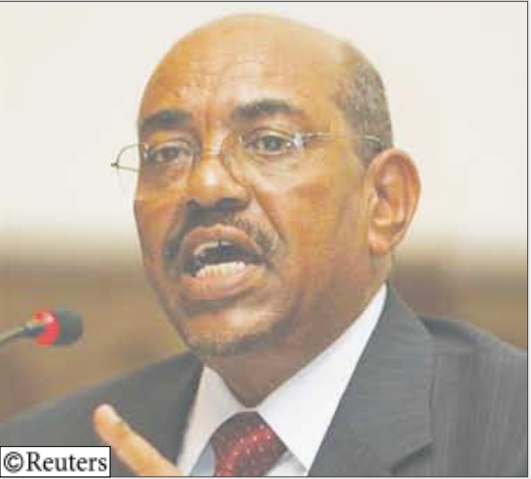
الرئيس السوداني عمر البشير

القاهرة 14 أكتوبر / رويترز: بدأ وزراء العدل العرب يوم أمس الأحد اجتماعاً استثنائياً بمقر جامعة الدول العربية في القاهرة لبحث الدفوع القانونية التي يمكن أن يقدمها على إثر اعتقال البشير في الخرطوم. وتطلب إلقاء القبض على الرئيس السوداني عمر البشير. وفي يوليو تموز قالت الدول العربية عقب اجتماع لمجلس وزراء الخارجية العرب إنها لا تقبل اتهامات الإبداء الجماعية الموجهة للرئيس السوداني وتطلبت إعطاء أولوية للحل السياسي لأزمة دارفور. وفي جلسة افتتاحية قال وزير العدل وزير الأوقاف والشؤون الإسلامية الكويتي حسين ناصر الحريتي رئيس مجلس وزراء العدل العرب إن الهدف من الاجتماع هو "اتخاذ موقف قانوني عربي موحد" تجاه مذكرة المدعي العام للمحكمة الجنائية الدولية. وأضاف أن مجلس الجامعة العربية على مستوى وزراء العدل "يمتلك من الخبرات والخبراء القانونيين ما يؤهله للتصدي لمثل هذه القضايا". ويشير الحريتي بذلك إلى أن وزراء العدل العرب سيؤكدون موقف وزراء الخارجية العرب الذي ينال أي إمكانية لإلقاء القبض على البشير.