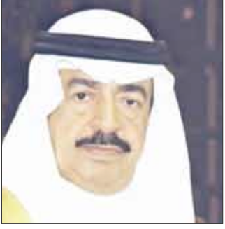
صاحب السمو الشيخ خليفة بن سلمان

حجم الاستثمارات الحالية والمتوقعة في البحرين والمراكز المتقدمة التي تحصل عليها في تقارير التقييم الدولية المتخصصة. وأوضح صاحب السمو رئيس الوزراء أن البحرين استطاعت أن تحقق تقدماً اقتصادياً واجتماعياً في وجوه عدة وبالشكل الذي يضمن كفاءة الأداء الإنمائي، وأشار سموه خلال حديثه الصحفي إلى رؤيته ونظرتها إلى العديد من القضايا ذات الشأن المحلي البحريني وارتباطها بالتعاون الدولي، وانعكاسات الأوضاع العالمية على مجمل الأوضاع