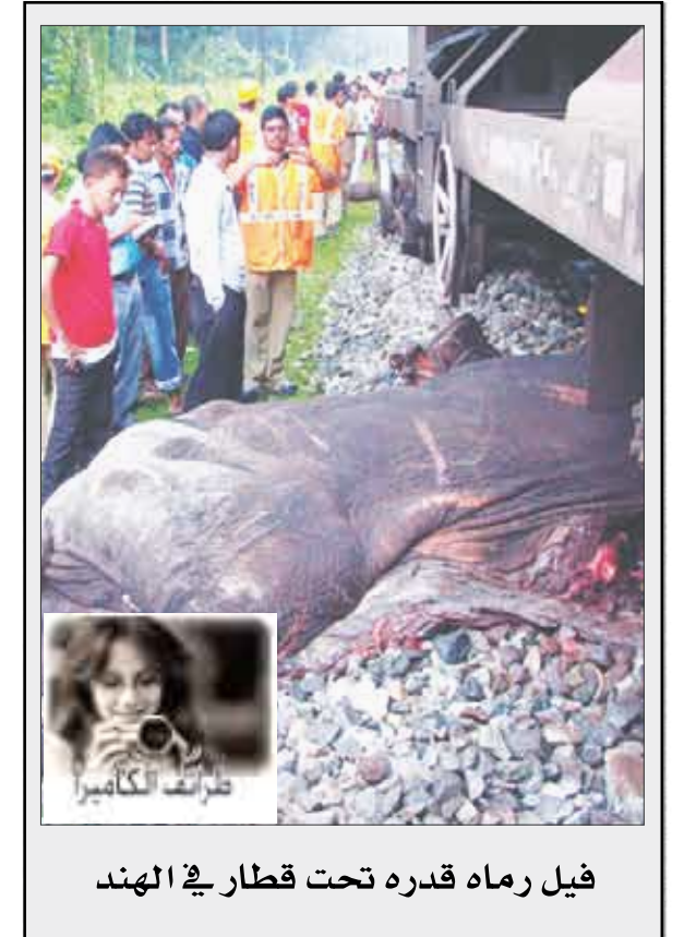
فيل رماه قدره تحت قطار في الهند

روسيا: حجم الاحتياطات الدولية يرتفع إلى (562,8) مليار دولار موسكو / متابعات : أعلنت دائرة العلاقات العامة في البنك المركزي الروسي أن حجم الاحتياطات الدولية الروسية قد بلغ بحلول 26 سبتمبر الماضي 562,8 مليار دولار مقابل 559,4 مليار دولار في 19 سبتمبر. وازداد حجم الاحتياطات الدولية لروسيا، بالتالي، خلال أسبوع واحد بمقدار 3 مليار دولار. وتحول البنك المركزي الروسي إلى استخدام مصطلح «الاحتياطات الدولية لأن مصطلح «احتياطي الذهب والعملات الصعبة» لم يعد متداولاً عالمياً.