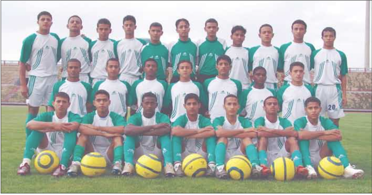
■ المنتخب الوطني