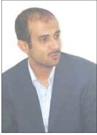
حمزة صالح أمين عام اتحاد اليد