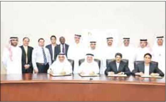
اتصالات تستحوذ على 45% من أسهم شركة هندية