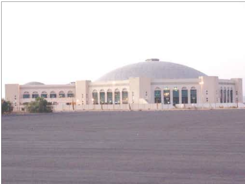
صالة 22 مايو في صنعاء