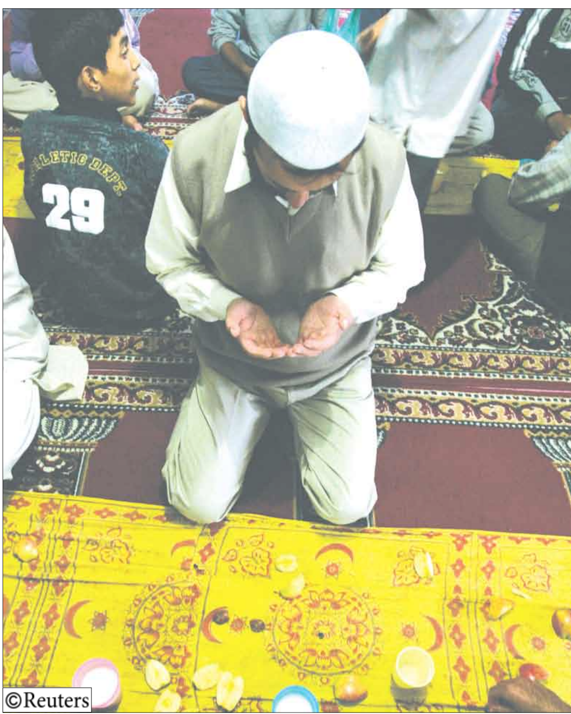
أحد المصلين في كشمير يبتهل إلى الله تعالى قبل أذان المغرب أمس الأول.