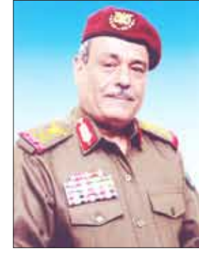
احمد علي الاشول

رفع وزير الدفاع اللواء الركن محمد ناصر أحمد ورئيس هيئة الأركان العامة اللواء الركن / احمد علي الاشول برقية تهنئة لفخامة الأخ الرئيس علي عبدالله صالح رئيس الجمهورية القائد الأعلى للقوات المسلحة بمناسبة احتفالات شعبنا بأعياد الثورة اليمنية الخالدة .. جاء فيها :