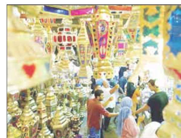
وحوي يا وحوي - التي يرجع تاريخها للفراعة مرمدين بصوت واحد:

خلف البيوت ويقفزون ويقولون: الحذاء على أيديهن ويلففتها حتى: بشار أم أساور العيد قالوا باكر- عيد رمضان قديم للبنات قدم يا مع الوداعة، يا رمضان الصباح وهنّ "تخين": وتستحذ الفتيات عيد الفطر على رمضان متندم ثم تخرج النساء السيئيات العيد قالوا الليلة على القجوم وهنّ "تشردين قائلات: عيد الضحايا