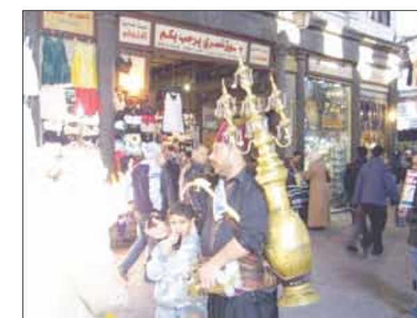
في المدن والقرى المصرية وذلك بتعليق الفوانيس التي يتفنون في صنعها، حيث أن للاحتفاء الشعبي به، خصوصيته وتأثيره الجمالي في عوموم الصالحين صفراً وكباراً، حيث تشهد الأسواق التقليدية حركة دؤوبة تتمثل في التنقل في تجهيز صناعة نماذج متنوعة من هذا الفانوس ومنه كما يوجد اليوم في باب الخلق، وما لبث الأطفال والصبية والذين حملوا الفوانيس مفتونين بنورها، حتى سارعوا بغنون الأغاني الدينية في الشوارع والطرق لتليق الهاديا.