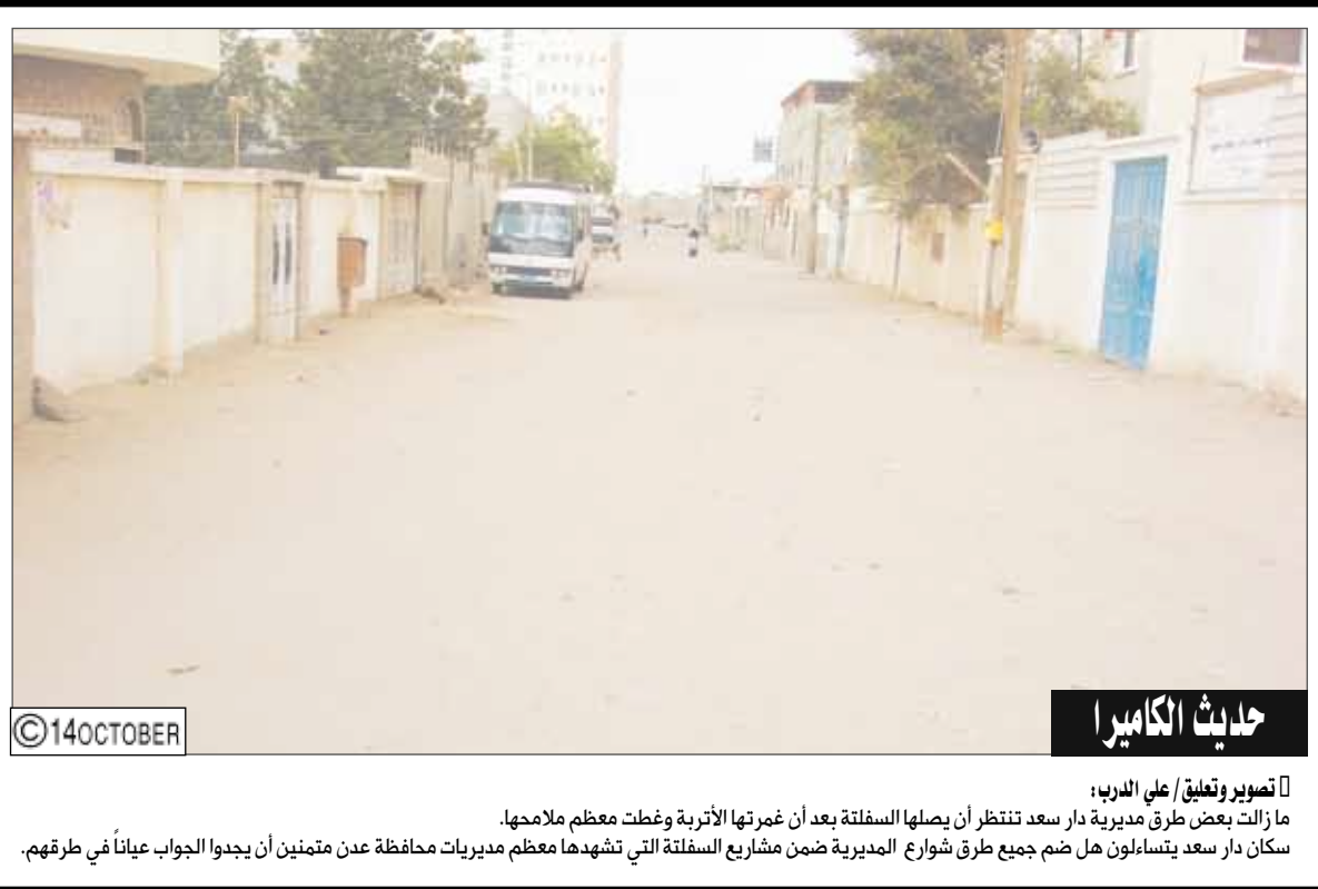
حديث الكاهن تصوير وتعليق / علي العريب: ما زالت بعض طرق مديرية دار سعد تنتظر أن يصلها السفلة بعد أن غمرتها الأتربة وغطت معظم ملامحها. سكان دار سعد يتساءلون هل ضم جميع طرق شوارع المديرية ضمن مشاريع السفلة التي تشهدا معظم مديريات محافظة عدن متمنين أن يجدوا الجواب عينا في طرقهم.