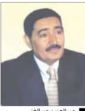
عبد العزيز عبد الغني

تعملون جيداً أن الدولة ويتوجهيات من فخامة الأخ رئيس الجمهورية تعاملت بإخلاص مع المطالب المشروعة لأبناء محافظة الضالع وبقية المحافظات، فتم معالجة وحل مشاكل المتقاعدين، والمنقطعين، بتسوية أوضاعهم وإعادةهم إلى الخدمة، رغم أن جزءاً كبيراً منهم طالب بالتقاعد برغبة شخصية محضة، وعبر عن أسفه حيال أولئك البعض ممن استمروا لعبة تجيش العواطف لدى البعض من أبناء المحافظة، ودفعها دفعا إلى ما يسىء للوطن وذلك لتحقيق مكاسب سياسية، وأصفاً بعض الاحتجاجات التي شهدتها المحافظة بأنه يصطدم مع الدستور والقانون، بما أطلقته من دعوات العودة إلى الماضي التشطيري البغيض، ومضى يقول إن هذا يناقض السلوك النضالي الذي ميزت به محافظة الضالع، حيث خاض أبناء هذه المحافظة تضالاً وطنياً مشرفاً في سبيل النظام الجمهوري والاستقلال والوحدة والديمقراطية. واعتبر ما يحدث اليوم تحت مسمى الحراك الجنوبي، إنما يستهدف المصالح الراسخة للشعب