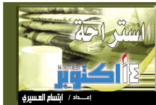
إعداد / إنشام العسيري

كرونيكا / متابعة : حذر خبراء ألمان المسنين من تعرضهم للإدمان نتيجة تناولهم للأدوية دون أن يشعروا بذلك أحد من المحيطين بهم في الغالب. وقال مارتن هاوبت نائب رئيس الجمعية الألمانية للطب العقلي والنقسي لكبار السن أنه في مثل هذه الحالة يعتقد غالباً بطريق الخطأ - أن الاضطراب الذي يعاني منه المسنون هو علامة من علامات الشيخوخة رغم أن ذلك قد يعني إدمانهم للأدوية العلاجية. وينصح الخبراء بضرورة أن يعرف أفراد الأسرة عدد الأقراص المنومة والمسكنات التي يتناولها كبار السن الذين يعيشون معهم. ومما يذكر أن العقاقير تتفاعل داخل أجسام المسنين بمعدل أبطأ مما قد يؤدي إلى تناول جرعات زائدة منها أو يصبح العقار عديم المفعول.