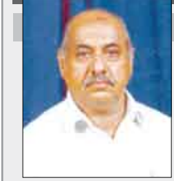
شعر / د. علوي عبدالله طاهر