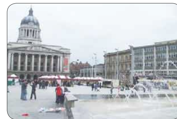
نوتنجهام / مآبعات

الدراسة ومن ثم ترجع حتى تطبخ رمضان، وعندما أخبرتهم بأنني أريد أن تكون لي وجبات في موعديين مخالف رفضوا ذلك، واضطرت لأن أتناول المعليات الجاهزة وأكلها، بعد ذلك أخرج أنا ومجموعة من الطلاب لجامع نوتنجهام لصلاة التراويح التي تشعري بأجواء السعودية، وأسعد كثيرا حينما يأتي يوم الجمعة الذي أفرط فيه في النادي السعودي مع بقية الطلبة السعوديون.