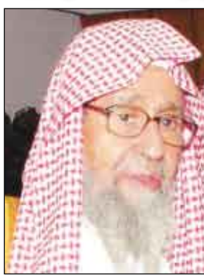
الشيخ صالح اللحيان