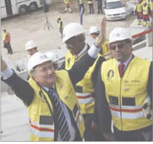
جوزيف بلا تر

بالمئة» في نجاح جنوب أفريقيا. ووجه بلا تر كلامه إلى المشككين قائلا «يجب أن يعترفوا بأن الاستعدادات ستكون جاهزة في الموعد المحدد، وسيتم استقبال الناس بشكل جيد، وما إلى ذلك من استعدادات». وأشار بلا تر إلى أن ما ينقص جنوب أفريقيا حقا هو المزيد من الحماس قائلا «يجب أن تقول البلد كلها: نعم، هيا بنا، لننضم بالأمر». وخلال الزيارة الحالية، يلتقي بلا تر كذلك مع زوما ورئيس البلاد السابق نيلسون مانديلا الذي لعب دورا حاسما في فوز جنوب أفريقيا بحق تنظيم كأس العالم لتصبح أول دولة أفريقية تستضيف البطولة الرياضية الأشهر في العالم.