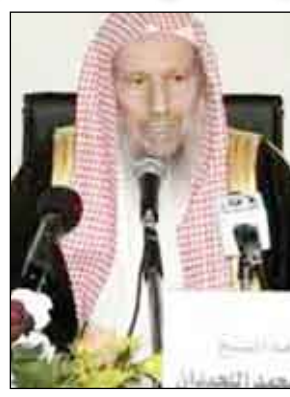
الشيخ صالح اللحيان

بعض البرامج التي يبثونها. وكان يشير إلى برامج ومسلسلات تداع في رمضان وهو شهر يفترض فيه التركيز على العبادة. ويقول منتقدون أن الطعام ومشاهدة التلفزيون بعد الإفطار. وظهر اللحيان على التلفزيون السعودي الليلة الماضية لتوضيح تصريحاته وقال أنه لم يقصد