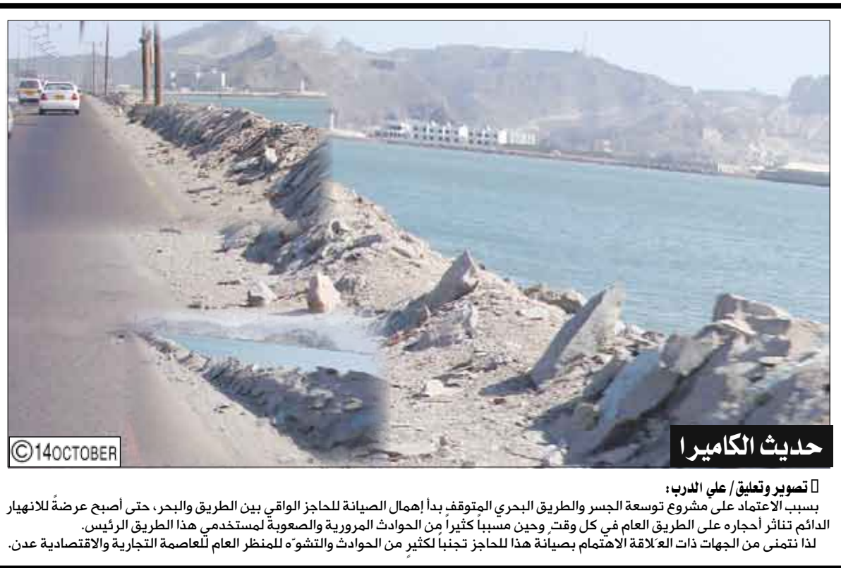
حديث الكاميرا: تصوير وتعليق / علي الدرب: بسبب الاعتماد على مشروع توسعة الجسر والطريق البحري المتوقف بدأ إهمال الصيانة للحاجز الواقي بين الطريق والبحر، حتى أصبح عرضة للانهايار الدائم تناثر أحجاره على الطريق العام في كل وقت وحين مسبباً كثيراً من الحوادث المرورية والصعوبة لمستخدمى هذا الطريق الرئيس. لذا نتمنى من الجهات ذات العلاقة الاهتمام بصيانة هذا الحاجز تجنباً لكثير من الحوادث والتشوه للمنظر العام للعاصمة التجارية والاقتصادية عدن.