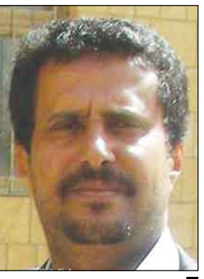
حسن محمد مناع

اطلع محافظ صنعاء حسن محمد مناع أمس على سير العمل في عدد من المكاتب التنفيذية بالمحافظة، ومستوى أداء العاملين فيها والانضباط الوظيفي خاصة في شهر رمضان المبارك. فقد زار المحافظ مكاتب التعليم المهني والفني والمقربين والخدمة المدنية والصناعة والتجارة والأعلام والشؤون الاجتماعية، وتعرف على الأعمال والأنشطة التي تقوم بها هذه المكاتب والمشاريع التي تنفذها وخطط العمل المرسومة، والإنجازات المحققة خلال الفترة الماضية من العام