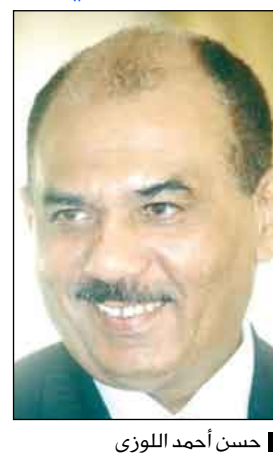
حسن أحمد اللوزي

عاد إلى صنعاء فجر أمس وزير الإعلام حسن أحمد اللوزي بعد مشاركته في المعرض الدولي (أي سي 2008) الخاص بمنتجات الأجهزة التقنية الاحترافية الإذاعية والتلفزيونية والاتصالات والذي اختتم أعماله يوم أمس الأول في العاصمة الهولندية أمستردام . وفي تصريح لوكالة الأنباء اليمنية ( سبأ ) أوضح اللوزي أنه أطلع خلال زيارته للمعرض على آخر المنتجات والتقنيات المتصلة بالإذاعة والتلفزيون .. مشيراً إلى أنه التقى على هامش المعرض العديد من رؤساء الشركات المصنعة للتقنيات