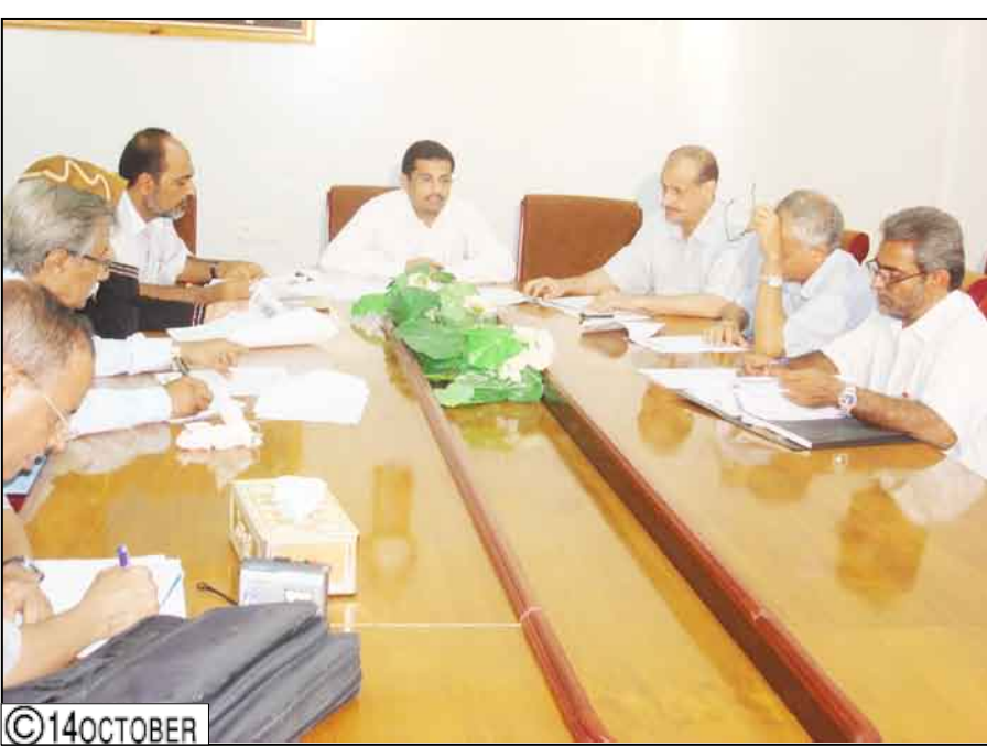
□ عدن / واد شيبلي