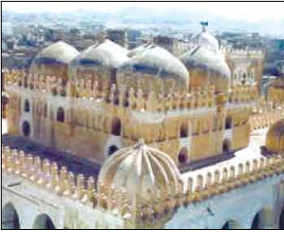
المشرفة التي ترفع قدر الإنسان.

وتذكر الروايات التاريخية ؛ ما إن وصل الصحابي معاذ بن جبل الجند حتى شرع ببناء مسجد في وسط مدينة الجند بتعز . ومن هذا المسجد أنطلق معاذ يعلم اليمنيين مبادئ الإسلام المضيئة ، وقبمه المثلئ ، وأصبح المسجد في ليلة وضحاها قبلة اليمنيين الذين آمنوا بالله رباً ، وبالإسلام ديناً ، وبمحمد نبياً . وكان هذا المسجد بمثابة الكيان الإسلامي المحسوس لليمنيين الذين دخلوا في دين الله أفواجاً . وبمعنى آخر ، كان المسجد الذي شيده الصحابي معاذ مركزاً للقيادة الإسلامية في اليمن يلتف حولها اليمنيون من ناحية ورسم لهم أيضاً حياتهم الاجتماعية ، والعقلية ، والسياسية الجديدة في إطار القيم الإسلامية