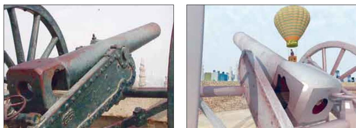
القاهرة/14 أكتوبر/ وكالة الصحافة العربية: الذي يعمل خلال شهر رمضان ، ويسمعه أهالي مصر من خلال أجهزة الراديو على أن يراؤوا فروع التوقيت من مدينة أخرى.

ويري الكثيرون من الأهالي أن انتشار مثل هذه العادة يسبب الإزعاج، لأنها في متناول الأطفال الذين يطلقون (مدافعهم) بشكل دائم خلال ساعات الإفطار، وحتى وقت السحور، وقد ثلاثت هذه الظاهرة في السنوات الأخيرة ، ليبقى مدفع ( الحاجة فاطمة ) صاحب السبق والمداومة في المغرب والفجر ، أوقت الإفطار والصائمون ، لوقت صلاة