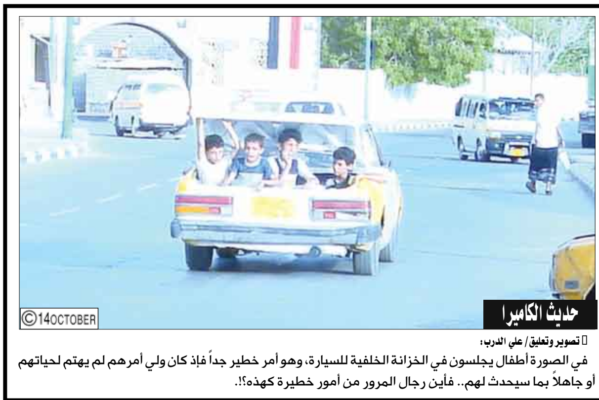
حديث الكاميرا تصوير وتعليق / علي الدرب: في الصورة أطفال يجلسون في الخزانة الخلفية للسيارة، وهو أمر خطير جداً فإذ كان ولي أمرهم لم يهتم بحياتهم أو جاهلاً بما سيحدث لهم.. فأين رجال المرور من أمور خطيرة كهذه!!

فين إكرامية رمضان.. العيد واجي والعيال بدون ملابس..