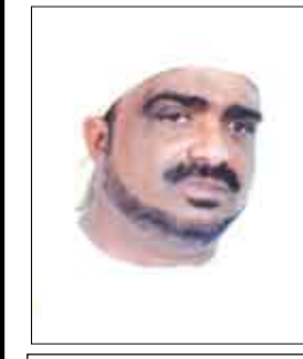
الشيخ / أنيس الحبشي

اصل بعث الرسل من الله تعالى هو هداية الناس إلى توحيد الله وعبادته وحده ونبذ الشركاء والأوثان .. والطواغيت من دونه ! قال تعالى : «إنا أرسلنا اليكم رسولا شاهدا عليكم ، كما أرسلنا إلى فرعون رسولا ، فعصى فرعون الرسول فأخذناه أخذاً مبيناً » من سورة المزمل . ومعجزة الرسلين الخالدة بينهم تكاد تتجلى في تخليده ذكرهم بين الأمم على تعاقب الأزمان والأجيال .. وتقديس رسالتهم .. وتعظيم أمرهم وكل رسول منهم آتاه الله آجره في الدنيا « وانه في الآخرة لمن الصالحين » .!