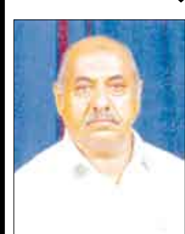
الشيخ الدكتور / علوي عبدالله طاهر

العبادة المشروعة في الإسلام من صلاة وصيام وزكاة وحج هي الطريق العملي لإصلاح حياة الإنسان وتطهير نفسه وجسمه ووجدانه من الأدران ، متى أحسنت ممارستها ، وأديت على خير وجه . وما العبادة في الإسلام إلا خلق ومبادئ ، وواجب ومسؤولية، فيها يخلق المجتمع الصالح، وعن طريقها ينهض المجتمع، ويتطور، ويواسطتها يتحقق النظام، ويسود الإخاء والتعاون والترحم والتكافل بين الناس.