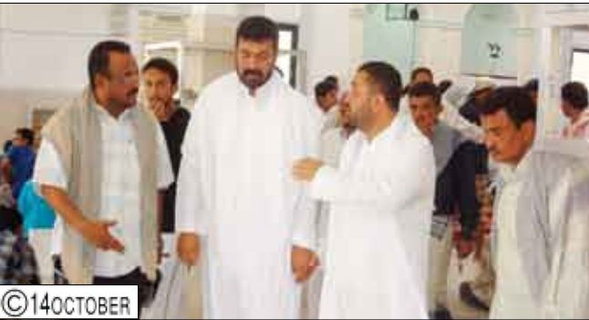
محافظ عدن يفتتح مسجد ( عكاشة ) في مديرية دار سعد

عدن / سبأ : افتتح محافظ عدن الدكتور عدنان الجفري أمس جامع عكاشة بمديرية دار سعد الذي تم بناؤه على نفقة فاعل خير بتكلفة اجمالية 70 مليون ريال . بعد الافتتاح طاف المحافظ بارجاء المسجد الذي يتكون من طابقين ويتسع لأكثر من الفأوق 200 مصلى بالإضافة الى مصلى خاص بالنساء ووقف خاصة به تعود بالخير والنفق على عامه المسلمین . واعرّب المحافظ عن سعادته لبناء المسجد الذي يؤدي رسالته السامية في الدعوة إلى