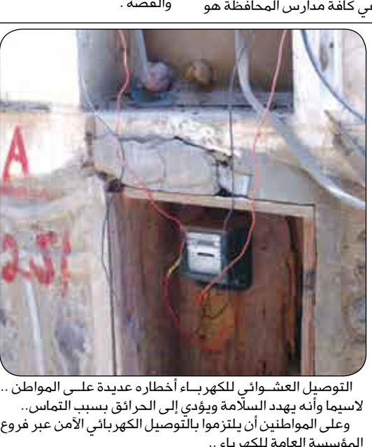
التوصيل العشوائي للكهرباء أخطاره عديدة على المواطنين ..