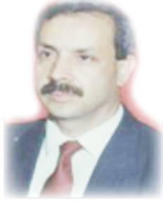
الشاعر السوري / قاسم عزاوي