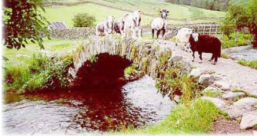
وكانت هذه الزيارة للمتعة والثقافة أي التعلم والاستكشاف. كما كانت المنطقة جزءاً من كتاب دينيل دوفو بداية القرن الثامن عشر وتبلغ مساحة المنطقة حوالي 885 ميلاً مربعاً (2.2 ألف كلم