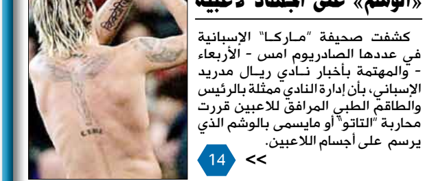
كشفت صحيفة «ماركا» الإسبانية في عددها الصادر يوم أمس - الأربعاء - والمهتمة بأخبار نادي ريال مدريد الإسباني، بأن إدارة النادي بقيادة الرئيس والمعلق الطبي الراحل للاعبين قررت ممارسة «التاتو» أو مايسمى بالوشم الذي يرسم على أجسام اللاعبين.