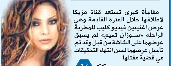
مفاجأة كبرى تستعد قناة مزكا لاطلاعها خلال الفترة القادمة وهي عرض أغنيتين فيديو لكليب للمطربة الراحلة «سوزان تميم» لم يسبق عرضها على الشاشة من قبل وقد تم تأجيل عرضها لحين انتهاء التحقيقات في قضية مقتلها.