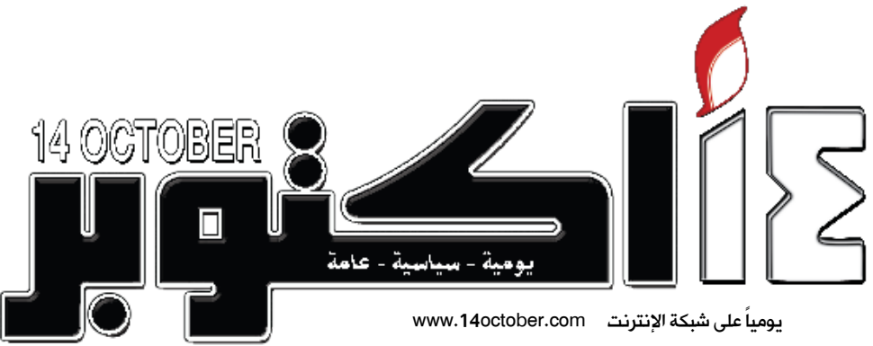
يومياً على شبكة الإنترنت www.14october.com