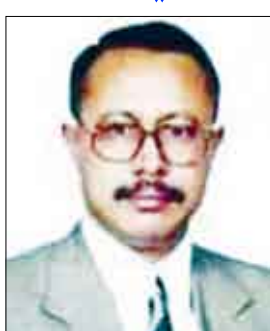
د. عبد العزيز بن حبتور