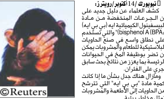
مادة كيميائية موجودة في البلاستيك تضر بوظيفة المخ لدى القردة

١٤ أكتوبر / رويترز: كشف العلماء عن دليل جديد على أن الجرعات المنخفضة من مادة البيسفينول أ الكيميائية (بي بي إيه) (BPA) والتي تستخدم على نطاق واسع في صنع الحاويات البلاستيكية للطعام والمشروبات يمكن أن تضر بوظيفة المخ في الحيوانات الرئيسة بما يعزز من نتائج بحث سابق أجري على القران. ومزائل هناك جدل بشأن ما إذا كانت كمية مادة بي بي إيه التي تترشح من الحاويات إلى الأطعمة والمشروبات تمثل مخاطر بيئية. وقال الصفر في الدراسة تيبور هاجسزنان في بيان صحفي من كلية الطب بجامعة بال في نيو هيفين بولاية كونيتيكت.