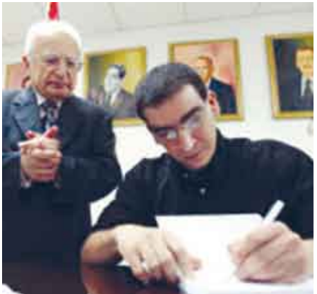
المؤلف يوقع على الكتاب

أرض الإسلام، وبالتالي فإن بقاء النظم الحالية يحول دون تحرير الأرض المحتلة، وبدأ الجهاد العالمي ضد