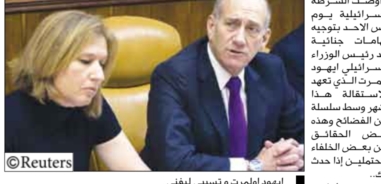
يهود أولمرت وتسييي ليفتي

عالم 2005 من أجل تأسيس كديما. العمل وهو الشريك الرئيسي لكديما في الحكم. باراك ليس عضواً في البرلمان ولذلك لن يكون بمقدوره أن يصير رئيساً للوزراء قبل أن يكون يبعد. ودعا باراك الذي كان أحد أفراد القوات الخاصة ورئيساً للوزراء بين 1999 و2001 إلى أن يختار كديما زعيماً جديداً، وحينما خاص حملة انتخابية لزعامه حزب العمل قال إن على أولمرت أن يستقيل اذا وجهه التحقيق مخطلاً فيما يتعلق بحرب