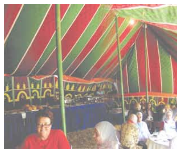
يصل إلى أذان الحضور .

من خلال ديكوراتها التي تتشابه في تصميمها مع المقهى الشعبي المعروف داخل الأحياء الشعبية * ويبقى أن الخيمة الرمضانية في قلب القاهرة القديمة، لها طابعها المتميز والأصيل، ودورها في إذكاء الروح الدينية، وسط الأجواء العامرة بروحانيات الشهر الفضيل.