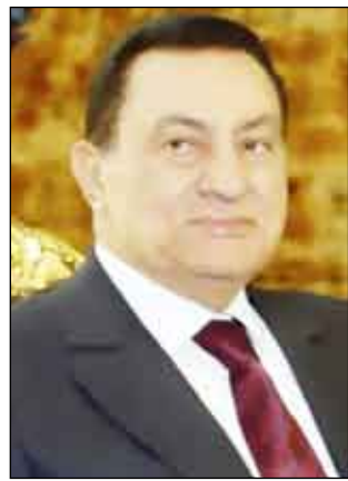
بالشفاء الجليل وان يجنب مصر وسائر بلاد المسلمين شر الكوارث والمحن انه سميع مجيب. وتقبلوا أسمى فسيح جناته، وان يمان على المصابين