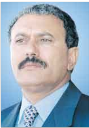
مواسلتنا القلبية... سائلين الله العلي القدير ان يتغمد ضحايا هذه الكارثة بواسر رحمته ورضوانه وان يسكنهم فسيح جناته، وان يمان على المصابين

بعث فخامة الأخ الرئيس علي عبدالله صالح رئيس الجمهورية برقية عزاء ومواساة إلى فخامة الرئيس محمد حسني مبارك رئيس جمهورية مصر العربية في ضحايا حادث الانهيار الصخري في منطقة الدوقية شرق القاهرة، جاء فيها: