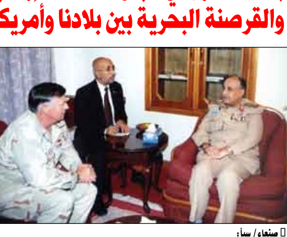
التقى وزير الدفاع اللواء الركن محمد ناصر أحمد أمس بصنعاء قائد القوات الأمريكية المشتركة في القرن الأفريقي الاميرال فيليب قرين.

وجرى في اللقاء بحث سبل تطوير العلاقات الثنائية بين الجيشين الصديقين اليمني والأمريكي والتعاون في مجال مكافحة الإرهاب والقرصنة البحرية والحفاظ على أمن الملاحة البحرية الدولية في منطقة البحر الأحمر.