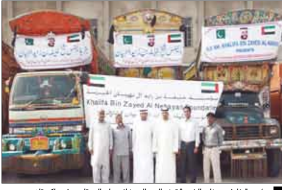
مؤسسة خليفة بن زايد الخيرية توزع المير الرمضاني على المحتاجين في باكستان

رمضان المبارك لمساعدة الفقراء والمحتاجين . وقال سعادة محمد حاجي الخوري المدير التنفيذي لمؤسسة خليفة بن زايد آل نهيان الخيرية أن هذه المكرمة للدول الإسلامية الشقيقة تأتي في إطار تحقيق أهداف المؤسسة من خلال تقديم العون والدعم اللازم للشراخ المجتمعية الفقيرة في تلك الدول ، مشيراً إلى أن هذه الشحنة من التمور سيستفيد منها حوالي 240 ألف أسرة . وأوضح أن هذه الشحنة التي أنجز شحنها جواً قبل بداية شهر رمضان المبارك تجيء في إطار حرص دولة الإمارات العربية المتحدة على تحسين حياة الفئات التي تعاني من وطأة الظروف المعيشية الصعبة ، موضحاً أن التمور تعد مصدراً غذائياً متكاملًا يساعد على أداء فريضة الصيام . وتأتي هذه المكرمة من صاحب السمو رئيس الدولة ، لتؤكد الاهتمام الكبير والمتواصل لدولة الإمارات العربية المتحدة حكومة وشعباً بالأشقاء في الدول الإسلامية حيث تعتبر دولة الإمارات أحد أهم ركائز العمل الخيري والانساني في العالم .