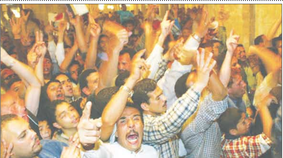
اللهم من سلطان.

والعرب أعضاء نشيطون في المنظمات العالمية المختلفة، كما أنهم من أنشط الناس في حضور المؤتمرات والاشتراك في المهرجانات والمناسبات الاجتماعية والرياضية المختلفة، لماذا - إذا - يختلف لدى كل عربي مخلص أن هذا النشاط كله مذهري صرف، وأن بعضه مقصود به التباهي، وأن البعض الآخر لا يعالمان المعاملة الجادة التي يستحقها؟ وتأخذ - مثلاً - قضية محو الأمية، وهي القضية الجهورية التي ينبغي أن تدور حولها الجهود للنهوض بالأمة العربية، ودفعتها دفعا من حياة القرون الغابرة إلى حياة القرن الحادي والعشرين، فتعجز الجهود في هذا الميدان الهام تعجزاً واضحاً ومخجلاً ، وبدلاً من أن ينقص عدد الأميين، يزداد عددهم عاماً بعد عام، بفضل ازدياد نسبة المولود، وكان جهاز محو الأمية جهاز (نحو الأمية) أي أنه لا يحمو الأمية، بل ينحو نحوها.