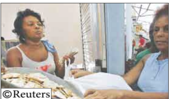
إمرأة في كوبا تتلقى حصص من الطعام

كوبا تقدم بدائل لمعونات الإغاثة الأمريكية من الإعصار