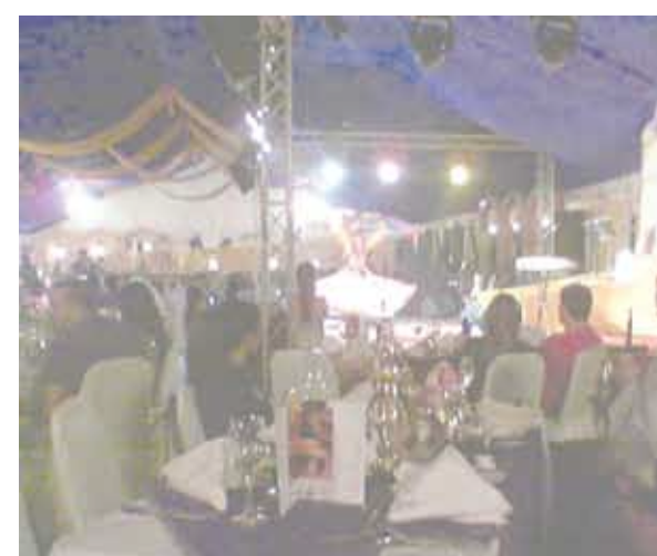
القاهرة / 14 أكتوبر / وكالة الصحافة العربية :

فرصت الخيام الرمضانية نفسها على الساحة الثقافية والفكرية كأحد أهم ملامح شهر رمضان المعظم، فهو مصطلح مصري يطلق على التجمعات الفنية والثقافية التي تشهدها ليالي الشهر الكريم، إلا أن المصريين يرون في هذه الخيمة نمطا اجتماعيا جديداً أفرزته الحياة المدنية التي تنتج نوعاً خاصاً من الاحتفال ليالي رمضان، وعادة ما تحوي الخيام الرمضانية صالونات أدبية وفنية ودينية حسب الجهة التي تقوم على تنظيمها، وكانت البداية من الطوائف الصوفية التي بدأت فكرة الخيام الرمضانية المليئة بالإنشاد الديني وحلقات الذكر ودروس العلم. غير أن النوادي والفنادق الفاخرة اقتبست الفكرة لتتحول تلك الخيام الرمضانية إلى ليالٍ فنية وغنائية يحييها فنانون وأدباء طيلة الشهر الكريم وسط أجواء ترفيهية لإعداد من التجمعات العائلية والشبابية التي ترضى غالباً تناول وجبة مختصة للضيافة والحرف.