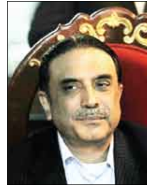
ترجمة تطلعات وآمال الشعب الباكستاني الشقيق في التعامل الحكيم والربصين مع كافة المعطيات الراهنة وخدمة مصالحه وخدمة الأمن والاستقرار والسلام في المنطقة والعالم.

بعث فخامة الأخ الرئيس علي عبدالله صالح رئيس الجمهورية رسالة تهنئة إلى فخامة الرئيس أصف زرداري بمناسبة انتخابه رئيساً لجمهورية باكستان الإسلامية الشقيقة جاء فيها: