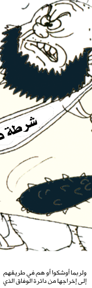
ولربما أوشكوا أو هم في طريقهم إلى إخراجها من دائرة الوفاق الذي

أجمعين وهم بذلك يريدون أن يفرضوا هيمنتهم على هذا البلد خارج قيمه ودينه الإسلامي الخفيف وسننونه وقوانينه التي ناضل وضحي من أجلها على امتداد القرن فهم يدعون تحت عباءة الإسلام وهم دعاة التخلف في أرقى صورته وأشكاله. ثم لماذا في هذا التوقيت من أجل إعادة نظام (أحمد يا جنابه)؟! فالشقيقة الملكية العربية السعودية، لم تكن هذه الهيئة إلا بموجب وفاق سياسي وليس ديني بين بيت آل سعود وبيت آل الشيخ وهم الآن بصدد الحد من هيمنة هذه المؤسسة التي كان ضررها أكثر من نفعها اجتماعياً وسياسياً وتطوراً