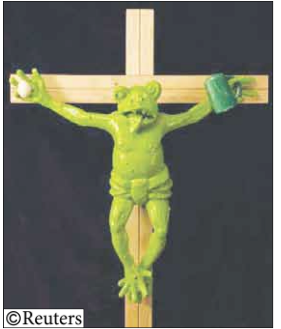
تمثال الضفدة المصلوحة

لأوما 14 أكتوبر/رويترز: تحدى متحف إيطالي البابا بنديكت السادس عشر ورفض إزالة تمثال من الفن الحديث يصور ضفدة خضراء مصلوحة تحمل قدحاً من الجعة وببضعة كان الفاسكان قد أدانه واعتبره مسيئاً للدين. وقرر القضاء لإزالة التمثال في مدينة بولزانو بشمال إيطاليا بأغلبية الأصوات أن الضفدة عمل فني وأنها تستظل في مكانها طوال فترة المعرض. ويصور التمثال الخشبي وهو من أعمال الفنان الألماني الراحل مارتن كينبيرجر ضفدة طولها حوالي متر و30 سنتيمتراً مصلوحة على صليب بني وتحمل قدحاً من الجعة في يد وببضعة في اليد الأخرى ، وترتدي الضفدة التي أطلق عليها «الأقدام أولاً» لباساً باللون الأخضر ومصلوحة بالمسامير من اليدين والقدمين بنفس طريقة صلب المسيح. ويتبدل لسانها الأخضر من فمها. وعرضت أعمال كينبيرجر في صالتي عرض تبت مودرن وساتشي في لندن وبنينالي فينيسيا ومن المقرر عرض أعماله في لوس أنجلوس ونيويورك. وقال مسؤولو المتحف إن كينبيرجر الذي توفي في عام 1997 اعتبرها صورة ذاتية توضح الفلق الإنساني. ولم يوافق البابا بنديكت وهو ألماني أيضاً على هذا الرأي.