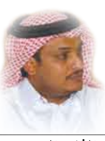
الشاعر السعودي علي الحازمي

عائشة كبرنا على الحب يا عائشة وكدنا نضيع قبلتنا في الدروب المريضة بالوقت والتعب القروي، لم تكن واضحين كما ينبغي للغراش بأن يتهافت في ظلنا كان صوتك أقرب للعشب من نفسه حين ينداح بين صنوف النخيل وينأى على ضحكة فآتنة