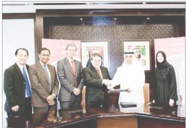
حكومة دبي تعلن إنشاء مكتب استشاري للتطوير والإبداع