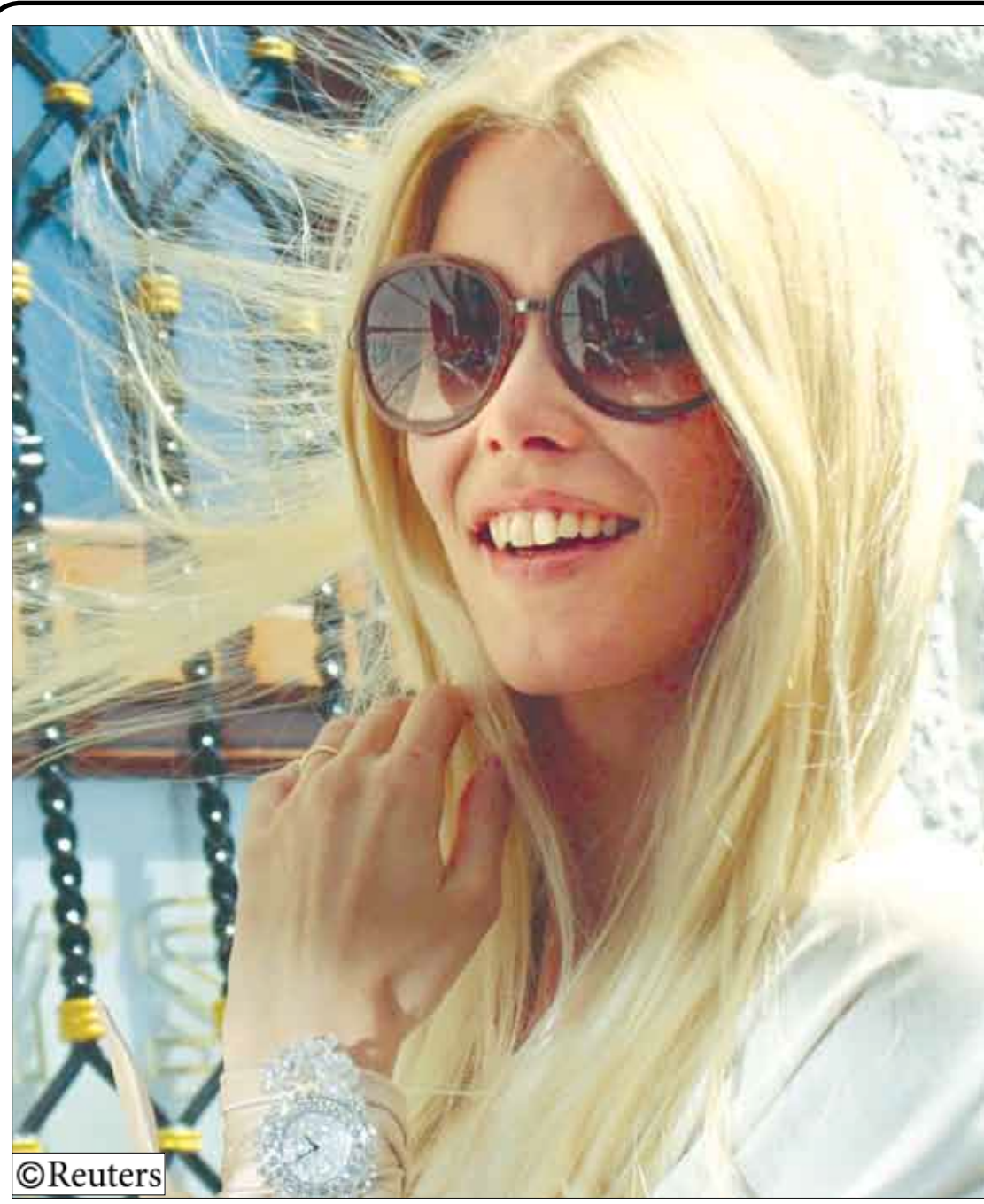
عارضة الأزياء الشهيرة « كلوديا شيفر » لدى وصولها الى « Bar's Harry » في فينيسيا بايطاليا لعمل دعائية لمنتجات الساعات يوم أمس الأول .

عدن / سبا: أفرغت أمس في إحدى مراسي ميناء الزيت بمصفاة عدن لتكرير النفط 40 ألف طن متري من مادة الديزل الواسلة من ميناء الفجيرة الإماراتي . وأفادت بيانات ملاحية من الميناء لوكالة الأبناء اليمنية (سبا) أن شحنة الديزل والتي أفرغتها ناقلة النفط الليبيرية (جلف لاين) ستوزع على كافة محطات الوقود العاملة في محافظات الجمهورية والموانئ اليمنية وبنتظام الحصص الاستهلاكية.