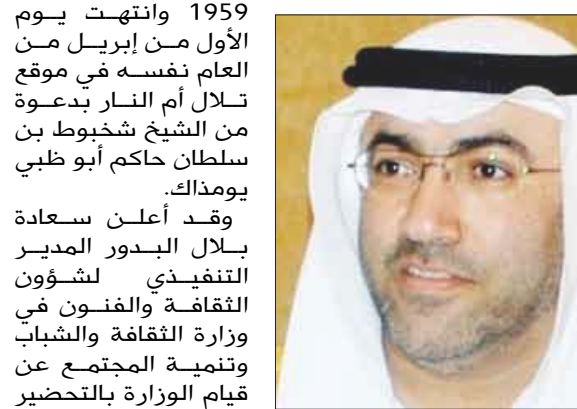
معالي عبد الرحمن بن محمد العويس

بناءً على توجيهات معالي عبد الرحمن بن محمد العويس وزير الثقافة والشباب وتنمية المجتمع مباشرة قطاع الثقافة والفنون الإعداد للاحتفال بمرور خمسين عاما على بدء أعمال التنقيب عن الآثار في الدولة لأول مرة والتي بدأت يوم العشرين من فبراير 1959 وانتهت يوم الأول من إبريل من العام نفسه في موقع تلال أم النار بدعوة من الشيخ شخبوط بن سلطان حاكم أبو ظبي يومذاك.