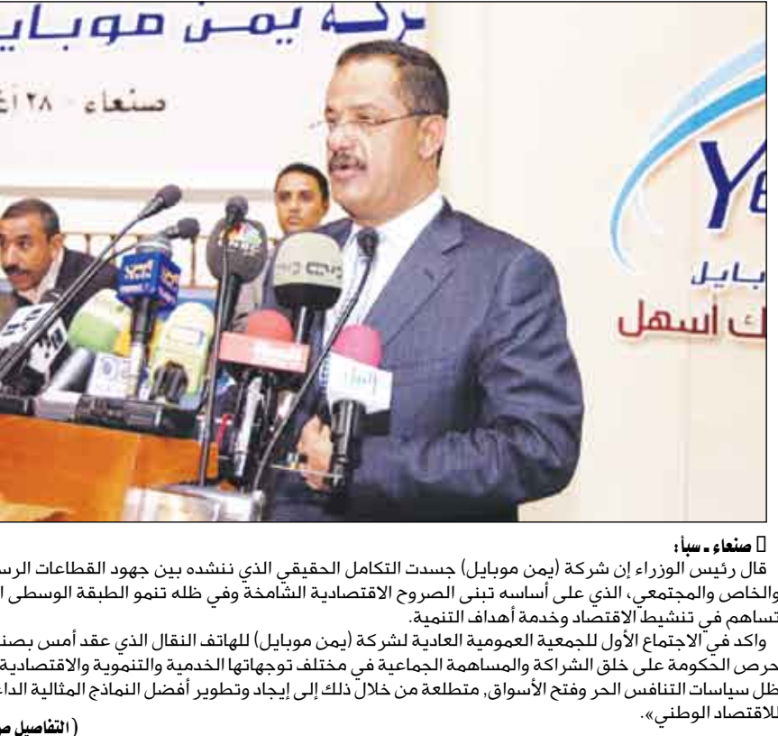
صنعاء - سبأ / قال رئيس الوزراء إن شركة (يمن موبايل) جسدت التكامل الحقيقي الذي ننشده بين جهود القطاعات الرسمي والخاص والمجتمعي، الذي على أساسه تبني الصروح الاقتصادية الشامخة وفي ظل نمو الطبقة الوسطى التي تساهم في تنشيط الاقتصاد وخدمة أهداف التنمية.

واكد في الاجتماع الأول للجمعية العمومية العادية لشركة (يمن موبايل) للالتفات النقال الذي عقد أمس بصنعاء، حرص الحكومة على خلق الشراكة والمساهمة الجماعية في مختلف توجهاتها الخدمية والتنموية والاقتصادية في ظل سياسات التنافس الحر وفتح الأسواق، متطلعة من خلال ذلك إلى إيجاد وتطوير أفضل النماذج المثالية الداعمة للاقتصاد الوطني.