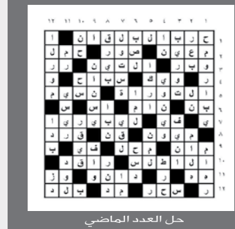
حل العدد الماضي

أفقيا : حرب جرت بين تغلب و بكر في الجاهلية دامت أربعين سنة اشتهرت بشعر المهلهل في رثاء أخيه - للتعريف مكتشف كروية الأرض - الة موسيقية قرص التعبان - بلد آسيوي اكتمل - صوت المريض من أشهر أنهار فرنسا - وكالة الأنباء السورية دماغ - ميثاق - رجم يقصص - مدينة أردنية - كثير سلام واستقرار - بلد أفريقي يضع - للتمني - حيوان قطبي يعالج - من الخضروات وادي في جهنم - من الأوزان - أقارب أداة جزم - من الزهور العطرية - مطلوب عموديا : صغير الخروف - والدة - شهر سرياني إحدى الإمارات العربية - بحر من الطيور - مصباح