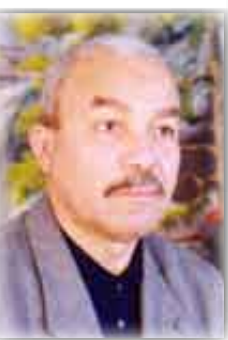
الشاعر التونسي احميد صولي

أَتَوَسَّدُ حُجْرَتِي وَأَنَا، فَالسَّاعَةُ تَعْرِقُ أَشْوَاقَ الْأُمَمِ فِي الصَّمْتِ، وَالنَّهْرُ يَبْوِّحُ فَتَاوَيْعَ تَعْلَازِلِ أَشْجَارِ الْمَوْتِ. السَّاعَةُ يَنْتَضُّ بِرُكَّانِ، وَلَا يَفْصَحُ، مَنْ قَالَ بِأَنَّكَ تَشْتَاقُ لِغَيْرِ الْمُنْبَحِ؟ أَتَصَفِّحُ أَحْدَاقَ النَّاجِينَ مِنَ الْعَفَةِ، فَاللَّجَّةُ تَحْبِلُ بِالْتَرَفِ. أَتَمْلِي رَائِحَةَ التَّعْبِ الْمَتْرَامِي فَالسَّاعَةُ تَنْهَالُ عَلَى الْأَنَاتِ أَكَابِيلِ الْخَوْفِ. أَيُّنُورَا لَوْهَمَ وَلَا تَنْهَضُ أَحْلَامِي؟ هِيَ ذِي صُورٍ لِأَعْيَاسِرِ تَرْوَعُ أَحْلَامَ الْكُشْفِ.