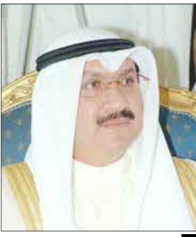
الشيخ سالم عبد العزيز الصباح

مع تطورات الأوضاع الاقتصادية المحلية مبينا في هذا الخصوص ان جهود البنك المركزي ساهمت في سحب فوائض السيولة البنائية لدى وحدات الجهاز المصرفي والمالي المحلي. وعن مشكلة القروض المحلية ذكر الشيخ سالم ان بنك المركزي اصدر تعليمات للبنوك وشركات الاستثمار المحلية بشأن الإجراءات التي يتعين الالتزام بها لدى تصويب المخالفات القائمة لديها لآسوس وقواعد منع القروض الاستهلاكية والمفستة. واکد ان البنك المركزي الزم تلك الجهات براجعة كل القروض القائمة لديها وحصر المخالفات وتقديم تقرير عنها وشهادة من مراقب الحسابات تفيد اتخا إجراءات التصويب اللازمة على أن يتم التصويب وتتمثل الجهات المسؤولة عن المخالفة الاعياء المالية الناتجة من ذلك. وقال ان المؤشرات دلت على قيام البنوك وشركات الاستثمار بتصويب المخالفات كما ان البيانات اوضحت ان عدد المخالفات بلغ نحو 29.5 ألف مخالفة وان تكاليف