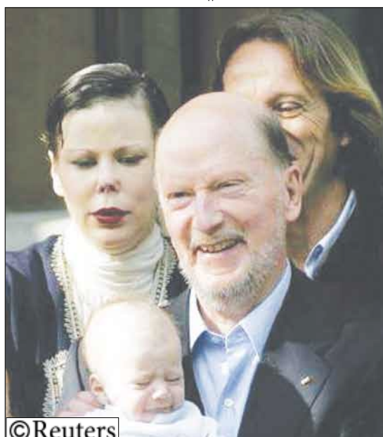
سيمون ساكسي كويورج ملك بلغاريا السابق (في مقدمة الصورة) وابنته الاميرة كاليينا (الى اليسار) وزوجها كيتين مونوز في العاصمة البلغارية صوفيا

لمريد/14 أكتوبر/ رويترز، قال المتحدث باسم شرطة المرور إن الأمير البلغاري كاردام الابن الأكبر لملك بلغاريا السابق أصيب بجروح خطيرة عندما اصطدمت سيارته بشجرة على طريق سريع في مدريد أمس الاول.