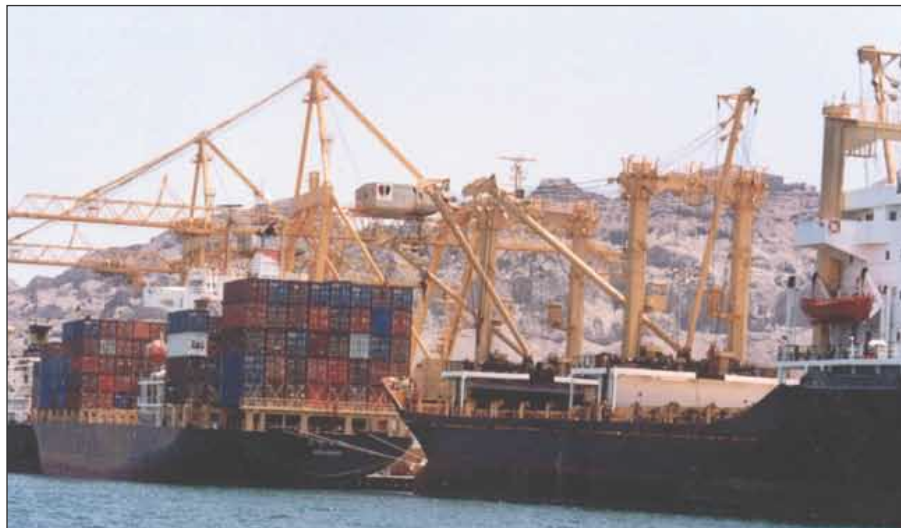
سفن حاويات في أرصفة المصلا