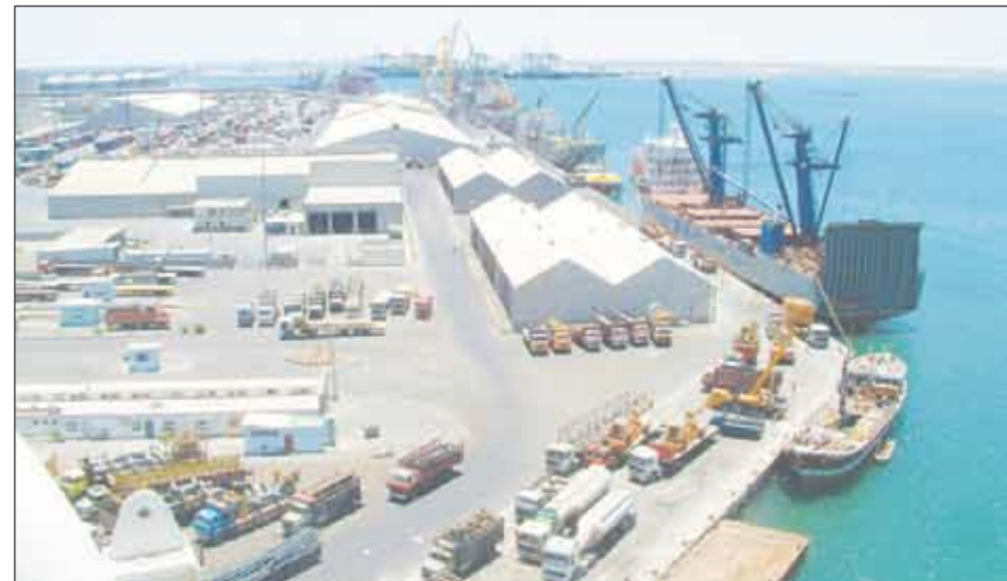
منظر عام لأرصفة المصلا

يمثل قطاع الشؤون البحرية والموانئ بوزارة النقل في بلادنا أهمية بالغة بين القطاعات الاقتصادية باعتباره أحد الركائز الأساسية في دعم وتعزيز مسيرة التنمية الشاملة التي شهدناها ويشهدها الوطن في مختلف مجالاتها.. وللمعرفة ما طرأ من عملية تحديث وتطوير لهذا القطاع التقينا بالقبطان / علي محمد الصبحي - وكيل وزارة النقل لقطاع الشؤون البحرية والموانئ وما تفكر الوزارة في تنفيذه خلال الفترة المقبلة وحصيلة هذا اللقاء في الآتي :-