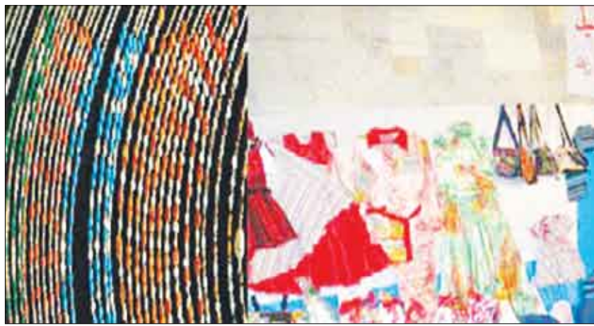
■ مشغولات يدوية (أرشيف)