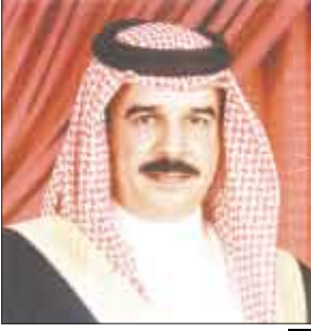
ملك البحرين حمد بن عيسى

وبقية المواد الاستراتيجية بالحجم والكمية التي تفي بالطلب المتزايد عليها ويسد احتياجات مقاولي البناء في ظل الطفرة العمرانية التي تشهدها مملكة البحرين في الوقت الحاضر . وأكد وزير الصناعة والتجارة حرص القيادة والحكومة البحرينية على توفير كافة المواد الاستراتيجية بما فيها مواد البناء بكميات وافرة وتغطي الاحتياج المحلي والبحث عن مصادر متعددة لهذه المواد بحيث يتم تفادي أي نقص أو شح يطرأ على نسبة المعرض من هذه المواد في الأسواق المحلية. كما نوه الوزير إلى تشجيع الحكومة وتقديمها لكافة التسهيلات للقطاع الخاص لتأسيس الشركات والمصانع التي تساهم في تعزيز هذه التوجهات وتحقيق تطلعاتها المنصبة في هذا الجانب.