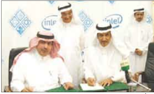
إثناء توقيع الاتفاقية

وخبرات إنتل في مجال التحقق الشامل لتبادلية التشغيل بين البنى التحتية والأجهزة الطرفية في المنطقة، كما يؤكد إنتل بنشر تقنية واي ماكس في الأسواق الناشئة. وكانت إنتل قد افتتحت بالفعل مختبرات لتبادلية التشغيل لشبكات واي ماكس لدى عدد من مشغلي الشبكات في مناطق أخرى بالعالم، مثل المختبر الذي أقيم لدى شركتي سيرينيت وكليرواير في الولايات المتحدة الأمريكية كما أنها تعمل على افتتاح المزيد من هذه المختبرات في جميع القارات. وتخطط إنتل بالتعاون مع مزودي الخدمات، ومنتجي معدات البنى التحتية، ومصنعي الأجهزة والحواسيب الشخصية، لبنه طرقات واي ماكس النقلة المحمده ضمن مجموعة مختارة من الحواسيب الشخصية المحمولة بنهاية العام 2008م الجاري في الولايات المتحدة الأمريكية. وبفضل حلول واي ماكس المبتدعة من إنتل والموجهة لمجموعة متنوعة من الأجهزة النقلة، فإن الشركة تعمل على الوفاء بوعودها بإتاحة اتصالات لاسلكية عريضة الحزمة في أثناء التنقل، تمتاز بالكلفة الاقتصادية والسرعة العالية.