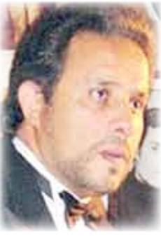
الشاعر البحريني / أحمد العجمي