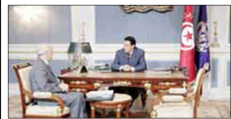
الرئيس زين العابدين