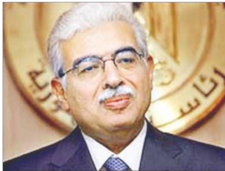
د. أحمد نظيف