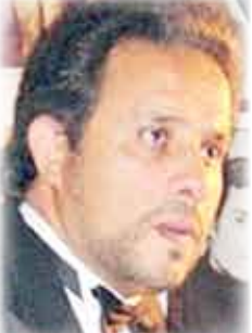
الشاعر المصري محمد غنيم

صار الزمن عدوا لنفسه صار كما صار الإنسان جعل الورد سجاجاً للأكفان تعبرون كل الكباري العلوية والسفلية تتبادلون الأناخب تسكبون الفكر في طاسات صدئة قد أثقلها النسيان تضعون في مناقير الطير سلاحاً وتتباكون على الحرية أخشى أن تبدل في أعينكم كل الأغصان